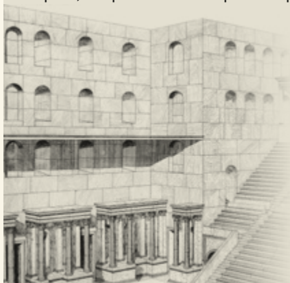
Εικ. 7 Αναπαράσταση των βάθρων στην πρόσοψη της σκηνής (Φ. Βερσάκης).