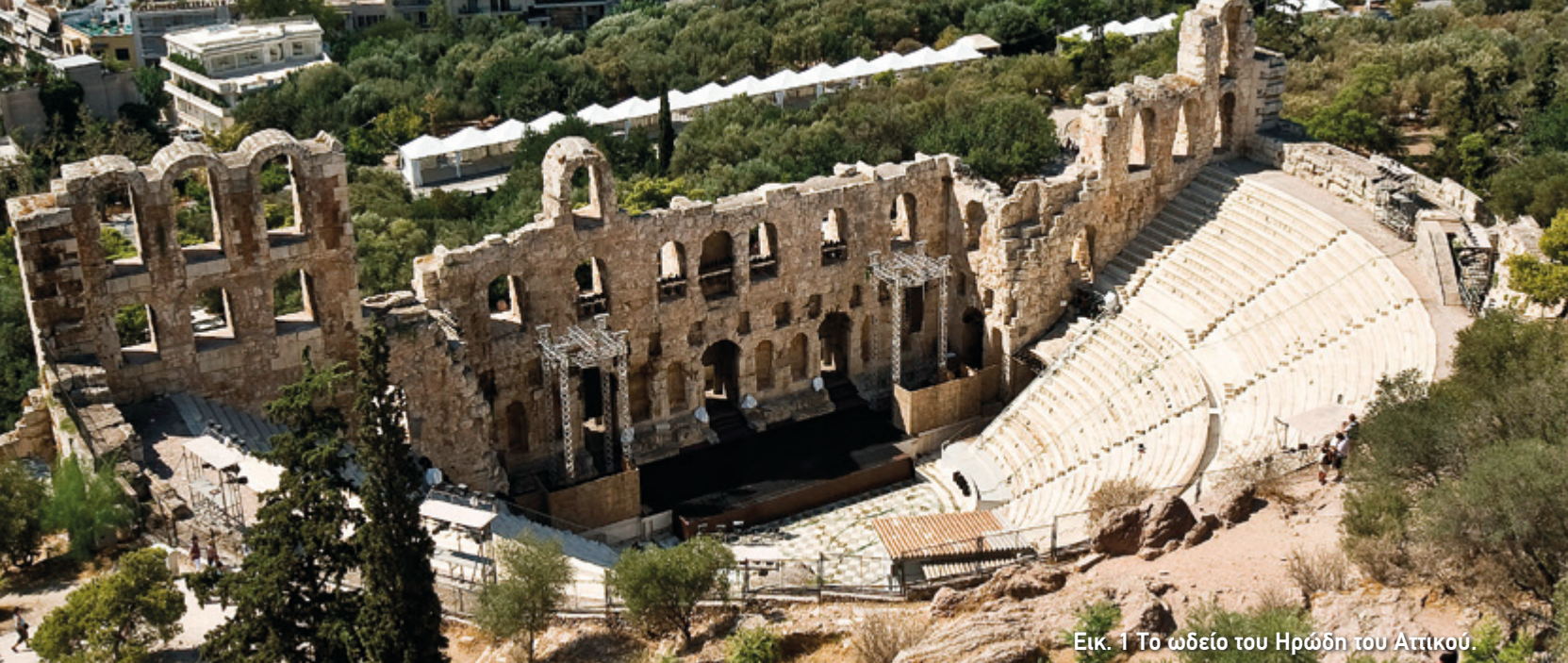
Εικ. 1 Το ωδείο του Ηρώδη του Αττικού.

«Έχει, μάλιστα, το ωδείο (της Πάτρας) αξιόλογη διακόσμηση ανάμεσα στα άλλα ωδεία των Ελλήνων, εκτός βέβαια από το αθηναϊκό· αυτό ήταν ανώτερο και ως προς το μέγεθος και ως προς την όλη κατασκευή»