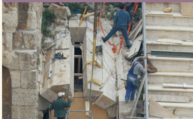
Εικ. 8 Η αναστήλωση της μίας παρόδου.

Η στέγη του ωδείου πρέπει να ήταν ένα μεγάλο τεχνολογικό επίτευγμα όχι μόνο για τα χρόνια εκείνα, αλλά και με τα μέτρα της δικής μας εποχής. Κατασκευασμένη, όπως μαθαίνουμε από τις πηγές, από ξύλο κέδρου που ήταν ιδιαίτερα δαπανηρό, φαίνεται ότι δεν στηριζόταν πάνω σε κατακόρυφα στηρίγματα κι αυτό είναι πολύ εντυπωσιακό, δεδομένου ότι κάλυπτε έναν πολύ μεγάλο χώρο. Ίσως έτσι δικαιολογείται και το υπερβολικό πάχος των τοίχων του ωδείου, οι οποίοι θα έπρεπε να συγκρατήσουν το τεράστιο βάρος της στέγης.