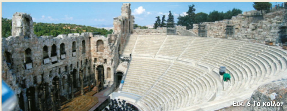
Εικ. 6 Το κοίλο.

Οι σειρές των καθισμάτων που κατασκευάσαν πάνω από τις παρόδους ένωσαν το κοίλο με το κτήριο της σκηνής (εικ. 6). Το κάτω κοίλο έχει είκοσι σειρές καθισμάτων. Η πρώτη σειρά όμως διαφέρει από τις υπόλοιπες. Λέγεται προεδρία και σε αυτή κάθονταν οι επίσημοι. Γι' αυτό το λόγο τα καθίσματά της φτιάχτηκαν με ξεχωριστή φροντίδα. Έχουν στήριγμα για την πλάτη, ενώ αυτά που βρίσκονται στα άκρα κάθε κερκίδας έχουν και στήριγμα για τα χέρια, διακοσμημένα στη βάση τους με πόδια λιονταριού. Μάλιστα, ένας διάδρομος χωρίζει την προεδρία από τις υπόλοιπες σειρές που προορίζονταν για τους απλούς θεατές. Ιδιαίτερα επιμελημένη όμως είναι και η τελευ-