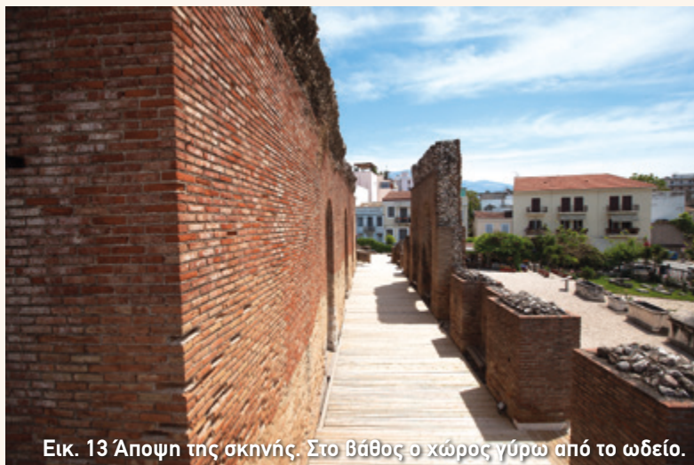
Εικ. 13 Άποψη της σκηνής. Στο βάθος ο χώρος γύρω από το ωδείο.