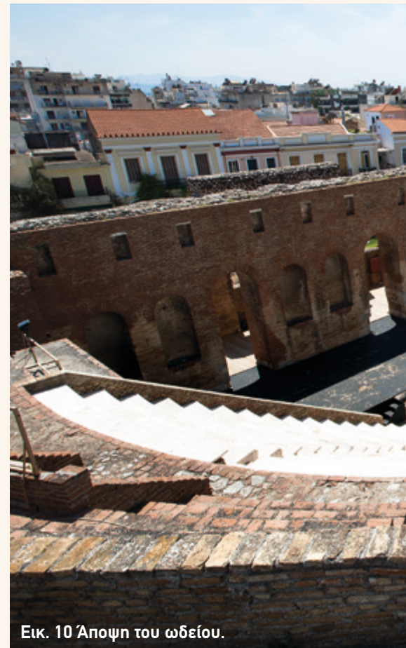
Εικ. 10 Άποψη του ωδείου.