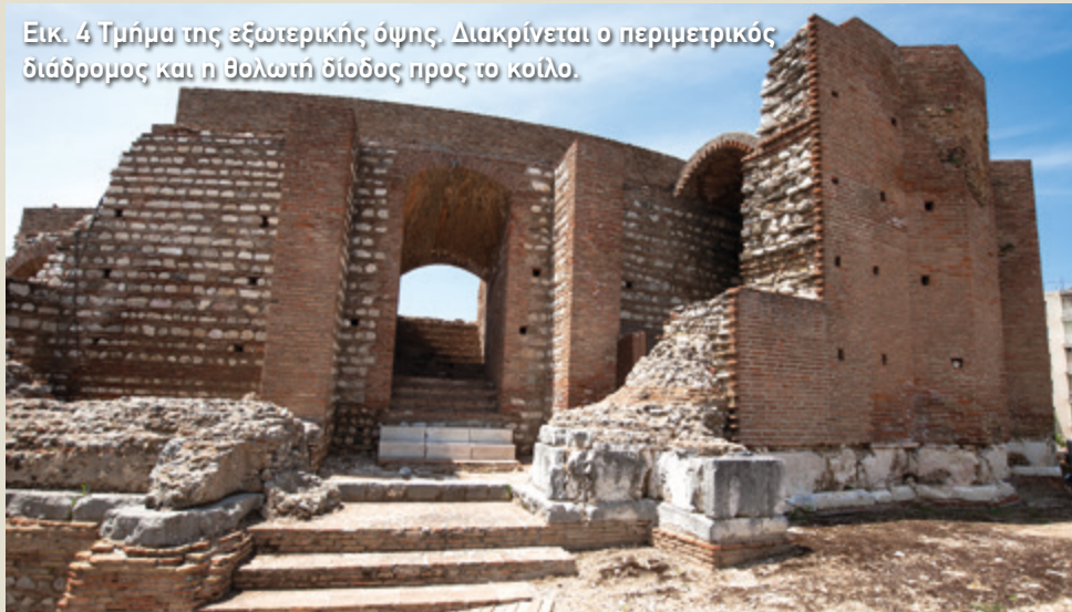
Εικ. 4 Τμήμα της εξωτερικής όψης. Διακρίνεται ο περιμετρικός διάδρομος και η θολωτή διάδος προς το κοίλο.

τοίχος του κοίλου έχει καταρρεύσει στο μεγαλύτερο μέρος του. Για να κινηθούν προς τις θέσεις τους οι θεατές είχαν δύο επιλογές. Μετά από κάθε είσοδο μπορούσαν να προχωρήσουν ευθεία και να ακολουθήσουν μία θολωτή διάοδο που με τη βοήθεια σκαλοπα-