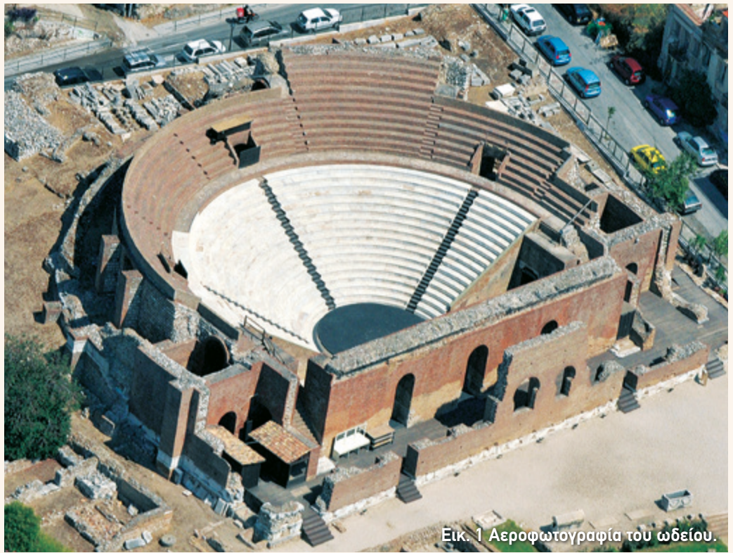
Εικ. 1 Αεροφωτογραφία του ωδείου.

Ωστόσο, μέχρι και το τέλος του 4ου αι. π.Χ. η Πάτρα δεν πρωταγωνιστεί στα ιστορικά γεγονότα του ελληνικού χώρου. Δεν συμμετέχει στους Περσικούς πολέμους και διατηρεί ουδέτερη στάση στον Πελοποννησιακό πόλεμο. Η εικόνα αρχίζει να αλλάζει στη διάρκεια των ελληνιστικών χρόνων. Έτσι, από τον 3ο αι. π.Χ. ο πληθυσμός της αυξάνεται και η πόλη επεκτείνεται προς τη μεριά της θάλασσας, χωρίς όμως ακόμα να την προσεγγίζει. Μάλιστα, το 280 π.Χ. με πρωτοβουλία της Πάτρας αναδιοργανώνεται το Κοινό των Αχαιών . Πρόκειται για μία πολιτική και στρατιωτική ένωση των αχαιϊκών πόλεων που υπήρχε και παλιότερα. Την περίοδο αυτή όμως αποκτά μεγαλύτερη δύναμη.