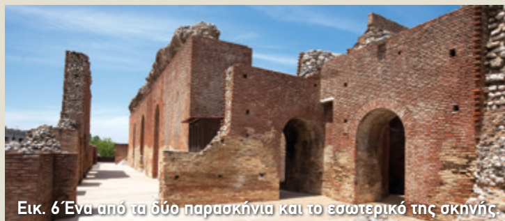
Εικ. 6 Ένα από τα δύο παρασκήνια και το εσωτερικό της σκηνής.