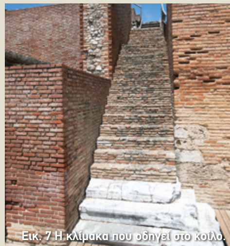
Εικ. 7 Η κλίμακα που οδηγεί στο κοίλο.

3, αρ.3). Ακριβώς δίπλα από τα παρασκήνια θα συναντήσετε δύο κλίμακες , δηλαδή σκάλες που οδηγούσαν ψηλά στο κοίλο (εικ. 7 & εικ. 3, αρ.4). Οι αρχαιολόγοι υποστηρίζουν ότι τις κλίμακες αυτές τις χρησιμοποιούσαν αποκλειστικά οι επίσημοι για να οδηγηθούν στις θέσεις τους που βρίσκονταν πάνω από τις παρόδους. Έτσι, σε αυτή την πλευρά του ωδείου δεν είχαν πρόσβαση όλοι ανεξαιρέτως οι θεατές, αλλά μόνο οι αξιωματούχοι και οι ιερείς. Ανάμεσα στις κλίμακες θα δείτε να ανοίγονται τρεις τοξωτές θύρες, από όπου περνούσαν οι πρωταγωνιστές για να εμφανιστούν μπροστά στους θεατές (εικ. 9).