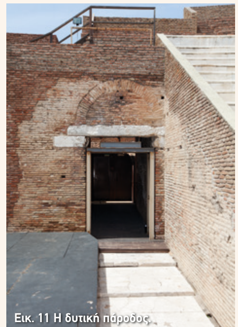
Εικ. 11 Η δυτική πάροδος.