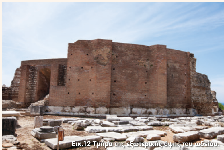
Εικ.12 Τμήμα της εξωτερικής όψης του ωδείου.

Στον εκπαιδευτικό φάκελο θα βρείτε πληροφορίες για δύο ακόμη ρωμαϊκά ωδεία που σχετίζονται με το ωδείο της Πάτρας. Αναζητήστε το έντυπο για το ωδείο της Νικόπολης, την πόλη που έχτισε ο Οκταβιανός Αύγουστος το 31 π.Χ. Η Νικόπολη και η Πάτρα ήταν τα δύο σημαντικότερα ρωμαϊκά κέντρα της δυτικής Ελλάδας. Μην παραλείψετε, επίσης, το έντυπο για το ωδείο του Ηρώδη του Αττικού στην Αθήνα που χτίστηκε λίγο αργότερα από αυτό της Πάτρας. Πρόκειται για τα δύο ρωμαϊκά ωδεία του ελλαδικού χώρου που ο Πausανίας ξεχωρίζει για το μέγεθος και την ομορφιά τους.