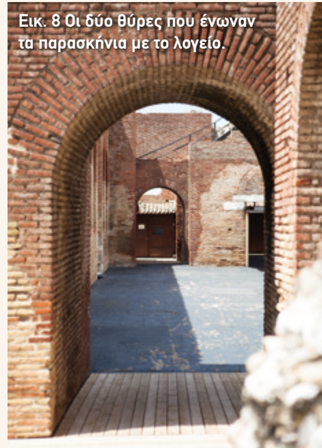
Εικ. 8 Οι δύο θύρες που ένωσαν τα παρασκήνια με το λογείο.

δύο σκάλες, οι οποίες δεν έχουν διατηρηθεί, ένωσαν το λογείο με την ορχήστρα. Το λογείο ήταν καλυμμένο με μία ξύλινη στέγη που δεν έχει σωθεί. Προστάτευε τους πρωταγωνιστές από τον ήλιο και τη βροχή, ενώ ταυτόχρονα ενίσχυε την ακουστική του ωδείου.