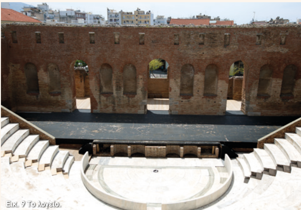
Εικ. 9 Το λογείο.