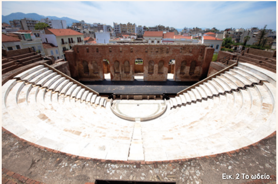
Εικ. 2 Το ωδείο.

Το σύνολο της κατασκευής και της διακόσμησης πρέπει να ήταν ιδιαίτερα εντυπωσιακό. Μάλιστα, ο Πausανίας που ταξίδεψε το 2ο αι. μ.Χ. σε όλο τον ελλαδικό χώρο, έγραψε ότι το ωδείο της Πάτρας ήταν το ομορφότερο απ' όλα όσα είχε δει, με εξαίρεση ένα: αυτό του Ηρώδη του Αττικού στην Αθήνα.