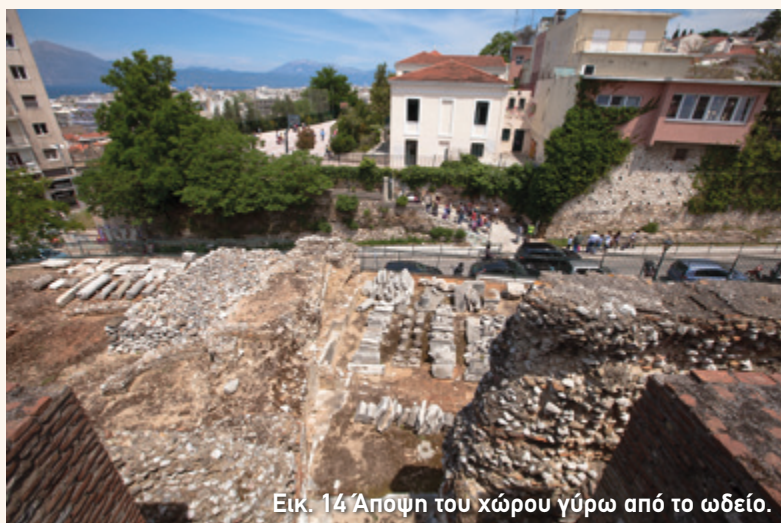
Εικ. 14 Άποψη του χώρου γύρω από το ωδείο.