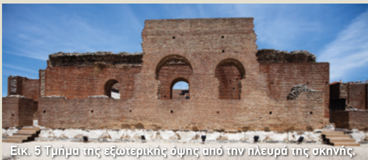
Εικ. 5 Τμήμα της εξωτερικής όψης από την πλευρά της σκηνής.

τιών τους οδηγούσε στο κοίλο (εικ. 4 - εικ. 3, αρ.1). Μπορούσαν όμως και να κατευθυνθούν προς τα άκρα του διαδρόμου για να συναντήσουν τις παρόδους , δηλαδή τους δύο κάθετους διαδρόμους που οδηγούσαν στην ορχήστρα (εικ. 3, αρ.2 - εικ. 11).