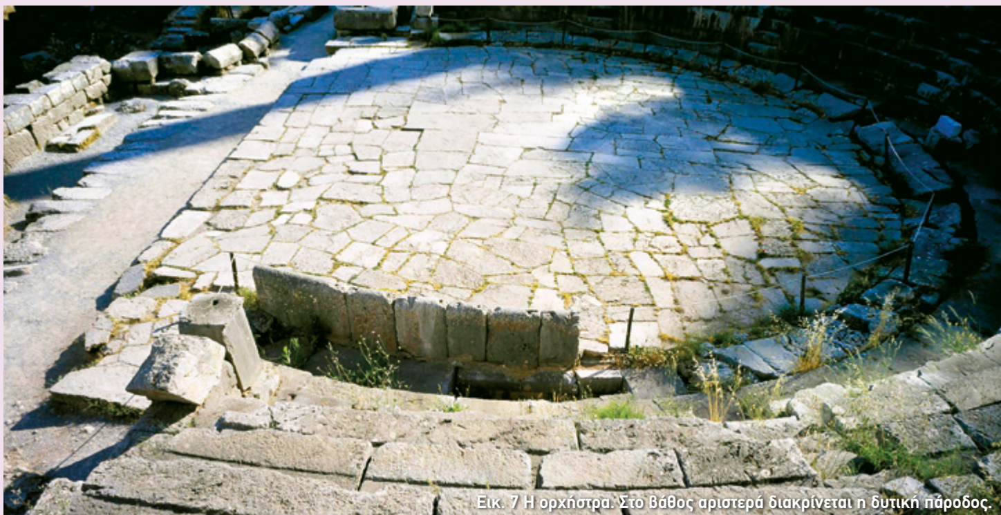
Εικ. 7 Η ορχήστρα. Στο βάθος αριστερά διακρίνεται η δυτική πάροδος.

ανοιχτός ώστε να συγκεντρώνει τα νερά της βροχής που κυλούσαν από τα εδώλια. Καλυπτόταν από πλάκες μόνο στα σημεία που συναντούσε τις κλίμακες του κοίλου, ώστε να δημιουργείται ένα πέρασμα. Ο αγωγός στη συνέχεια ακολουθούσε υπόγεια πορεία οδηγώντας τα νερά κάτω από τη σκηνή και έπειτα μακριά από το θέατρο.