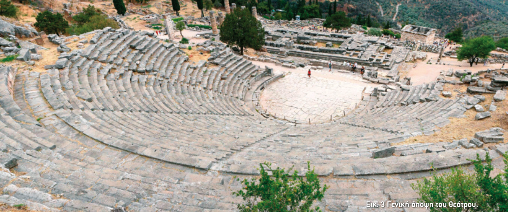
Εικ. 3 Γενική άποψη του θεάτρου.