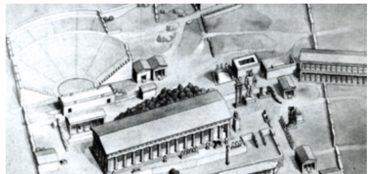
Εικ. 2 Πρόπλασμα του ιερού σύμφωνα με τον Pomtow.