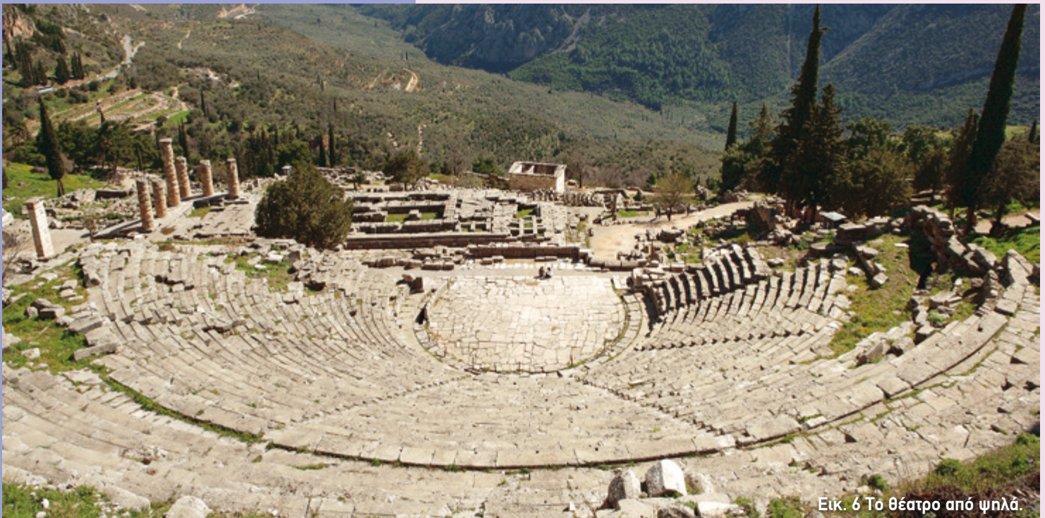
Εικ. 6 Το θέατρο από ψηλά.

Στα ρωμαϊκά χρόνια έγιναν αρκετές αλλαγές στο κτήριο της σκηνής. Έτσι, το προσκήνιο αντικαταστάθηκε από μία χαμηλότερη εξέδρα, το λογείο . Τον 1ο αι. μ.Χ., μάλιστα, η πρόσοψη του λογείου διακοσμήθηκε με ανάγλυφες παραστάσεις που απεικόνιζαν τους άθλους του Ηρακλή. Η διακόσμηση αυτή είναι πολύ πιθανό να συνδέεται με την επίσκεψη του Ρωμαίου αυτοκράτορα Νέρωνα στους Δελφούς το 67 μ.Χ. και την συμμετοχή του στους μουσικούς αγώνες των Πυθίων. Ο Νέρωνας ταύτιζε τον εαυτό του με τον Ηρακλή και έτσι οι υπεύθυνοι του ιερού για να τον κολακεύσουν απεικόνισαν τα κατορθώματα του αγαπημένου του ήρωα στο θέατρο.