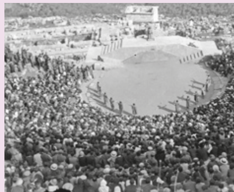
Εικ. 8 Φωτογραφίες από τις παραστάσεις «Ίκέτιδες» και «Προμηθέας Δεσμώτης» στις Δελφικές Γιορτές του 1930.