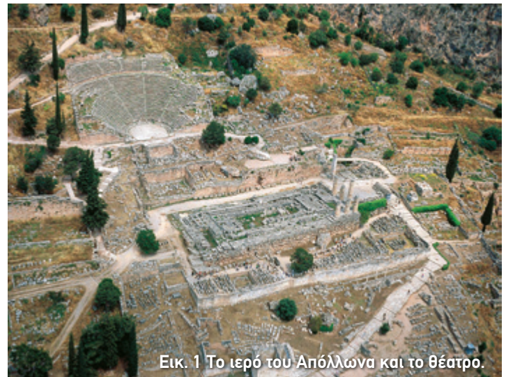
Εικ. 1 Το ιερό του Απόλλωνα και το θέατρο.

Οι ερευνητές θεωρούν ότι τα μουσικά και θεατρικά δρώμενα των Πυθίων και των Σωτηρίων αρχικά γίνονταν στους ελεύθερους χώρους του ιερού ή ακόμα και στη θέση όπου διαμορφώθηκε αργότερα το κοίλο του θεάτρου. Περιστασιακά μπορεί να φιλοξενήθηκαν ακόμα και στο στάδιο των Δελφών που χτίστηκε τον 3ο αι. π.Χ. Όμως, από το 2ο αι. π.Χ., οι μουσικοί και θεατρικοί αγώνες απέκτησαν το δικό τους χώρο, ένα λίθινο θέατρο μέσα στο ιερό του Απόλλωνα (εικ 1, 2).