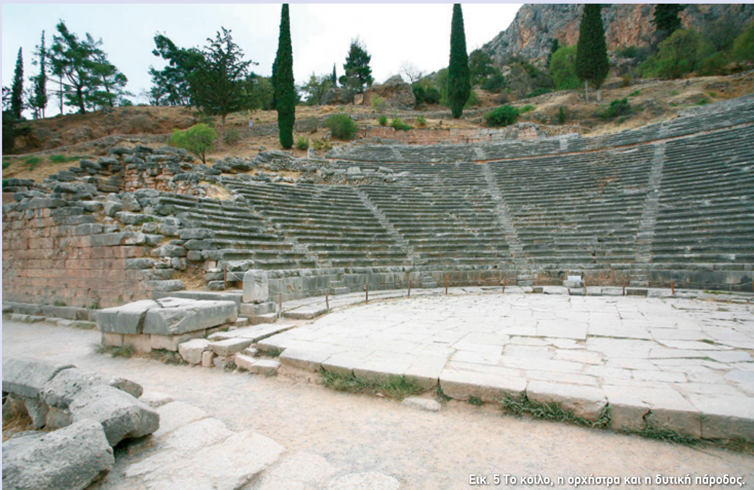
Εικ. 5 Το κοίλο, η ορχήστρα και η δυτική πάροδος.