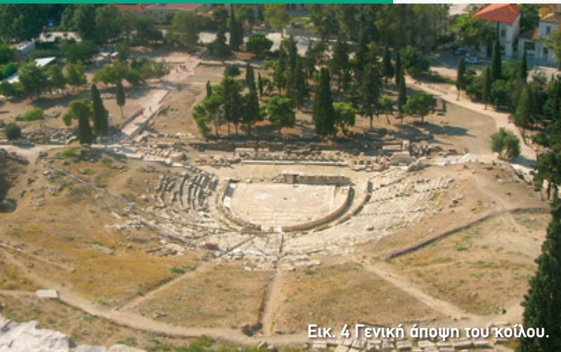
Εικ. 4 Γενική άποψη του κοίλου.