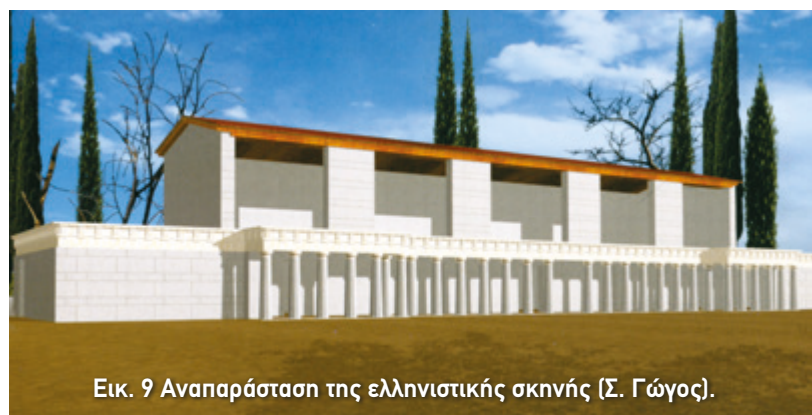
Εικ. 9 Αναπαράσταση της ελληνιστικής σκηνής (Σ. Γώγος).