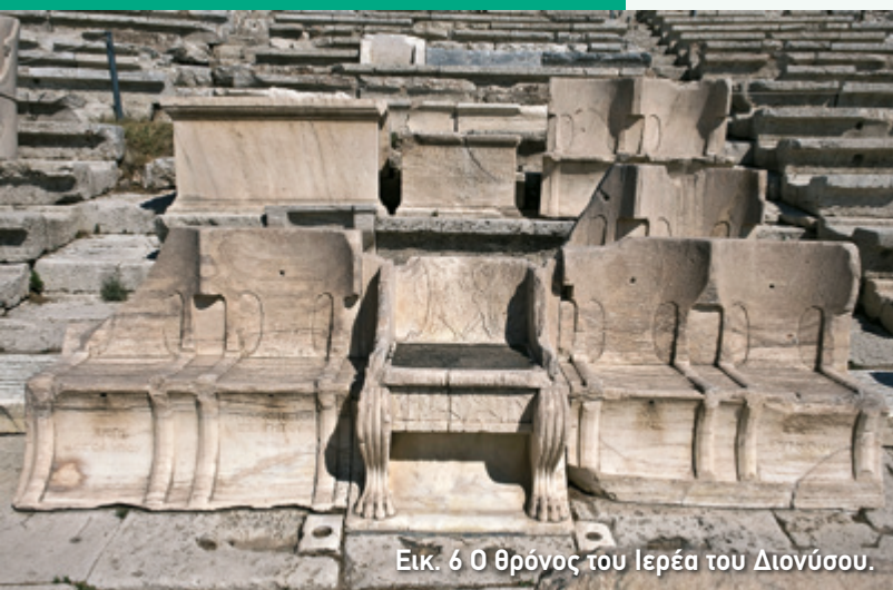
Εικ. 6 Ο θρόνος του Ιερέα του Διονύσου.