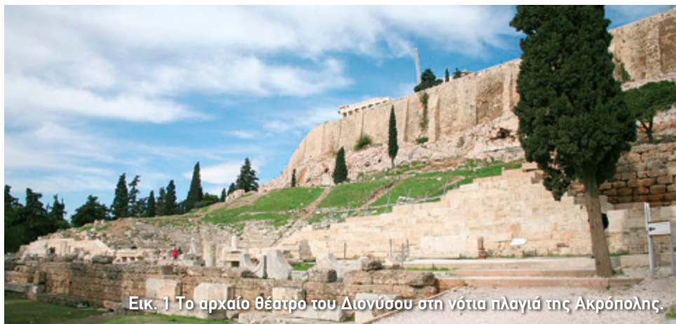
Εικ. 1 Το αρχαίο θέατρο του Διονύσου στη νότια πλαγιά της Ακρόπολης.

Δυστυχώς όμως ελάχιστα στοιχεία έχουν απομείνει από τα δύο πρώτα κτήρια, τα οποία δημιουργήθηκαν στις αρχές και λίγο μετά τα μέσα του 5ου αι. π.Χ. αντίστοιχα. Έτσι, ενώ γνωρίζουμε αρκετά από τα έργα των μεγάλων δραματικών ποιητών που ανέβηκαν εκεί, λίγα πράγματα ξέρουμε για το χώρο όπου αυτά πρωτοπαρουσιάστηκαν.