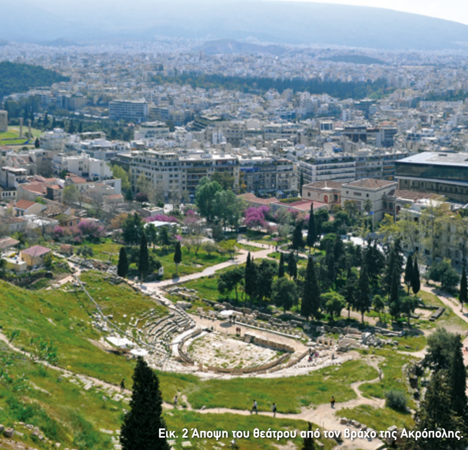
Εικ. 2 Άποψη του θεάτρου από τον Βράχο της Ακρόπολης.