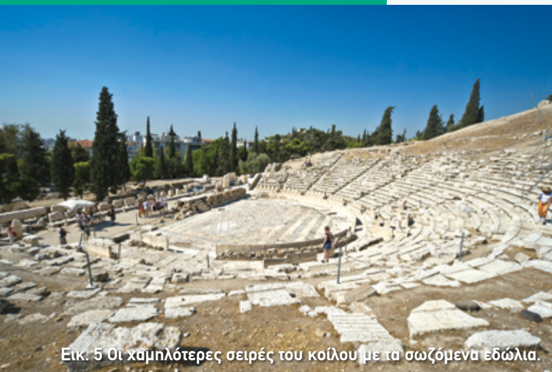
Εικ. 5 Οι χαμηλότερες σειρές του κοίλου με τα σωζόμενα εδώλια.