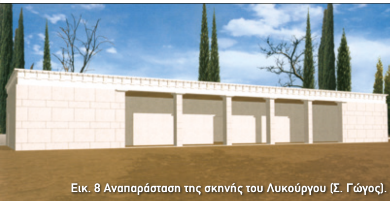
Εικ. 8 Αναπαράσταση της σκηνής του Λυκούργου (Σ. Γώγος).