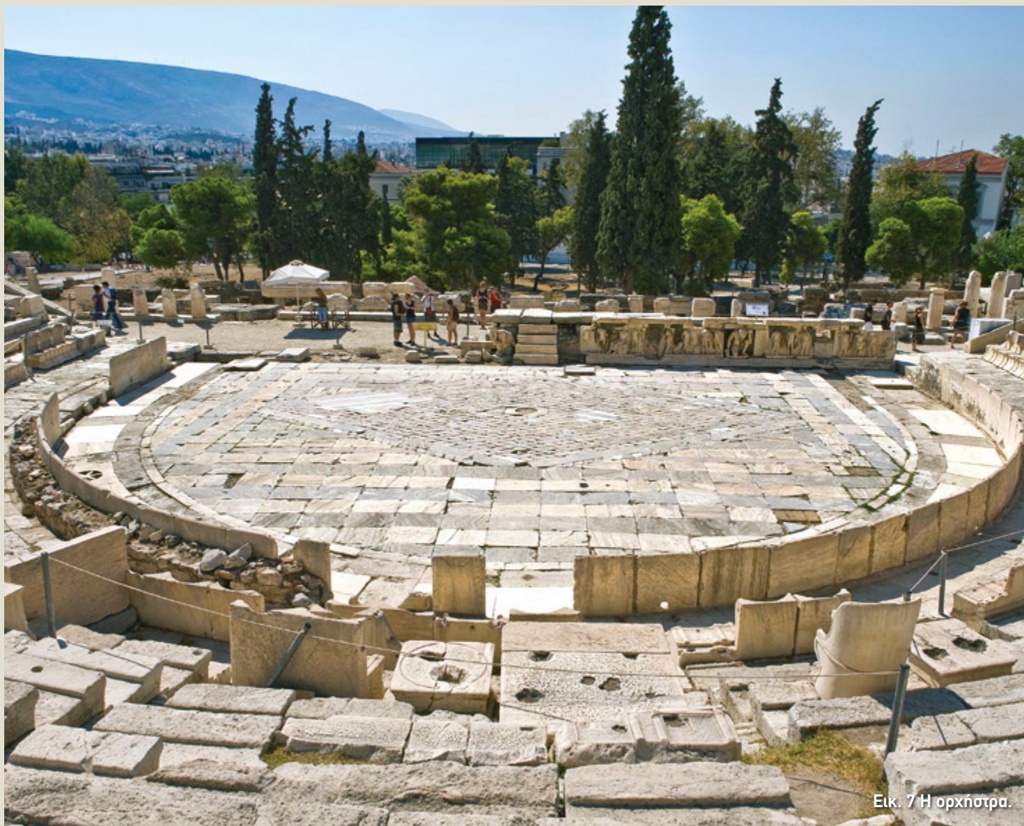
Εικ. 7 Η ορχήστρα.