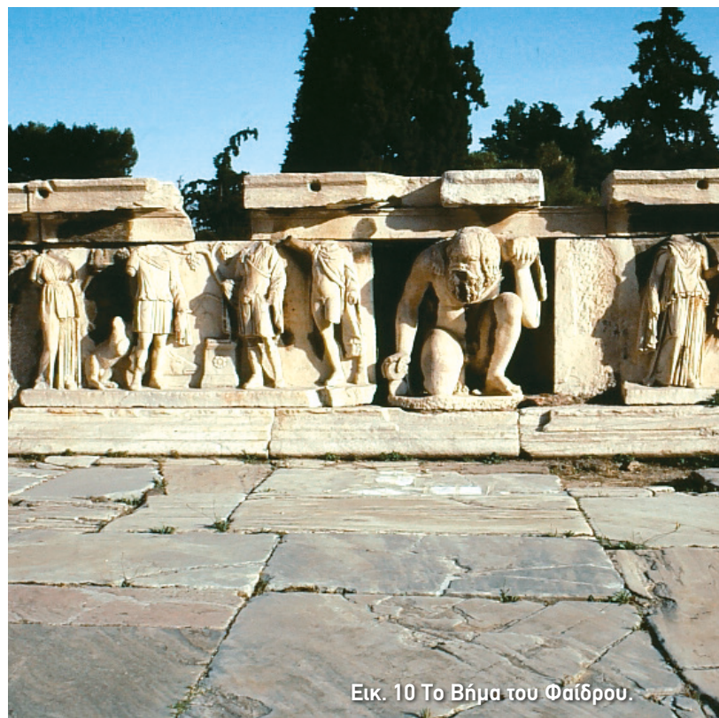
Εικ. 10 Το Βήμα του Φαίδρου.

Γύρω στο 60-61 μ.Χ. οι Ρωμαίοι δημιούργησαν μία νέα διώροφη σκηνή στη θέση της παλιάς. Μάλιστα, κατά τη συνήθειά τους να κατασκευάζουν εντυπωσιακά σκηνικά οικοδομήματα, η νέα σκηνή φαίνεται ότι ήταν πλούσια διακοσμημένη. Γλυπτά της μπορείτε να δείτε στο στέγαστρο που βρίσκεται λίγο πιο πάνω από την είσοδο του αρχαιολογικού χώρου. Για την εμφάνιση των ηθοποιών κα-