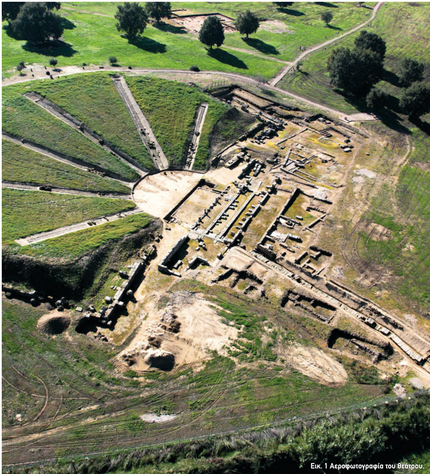
Εικ. 1 Αεροφωτογραφία του θεάτρου.