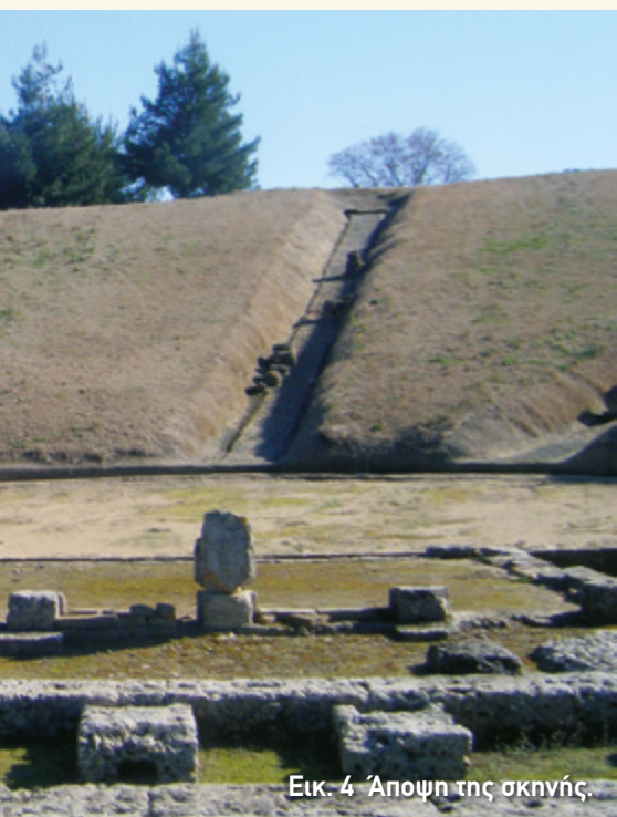
Εικ. 4 Άποψη της σκηνής.