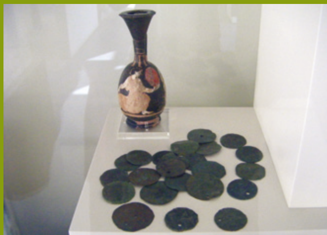
Εικ. 9 Χάλκινες ψήφοι από το θέατρο.