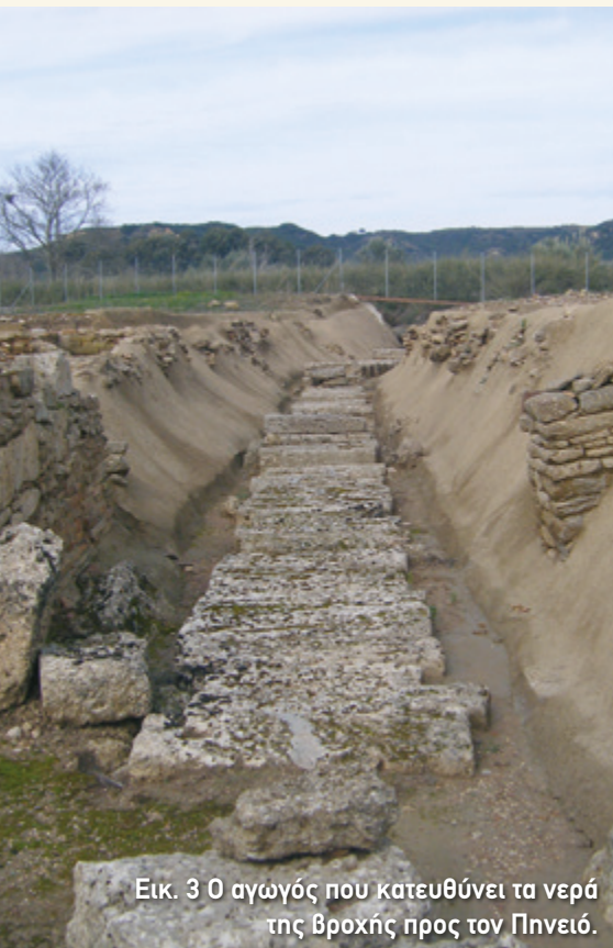
Εικ. 3 Ο αγωγός που κατευθύνει τα νερά της βροχής προς τον Πνευό.