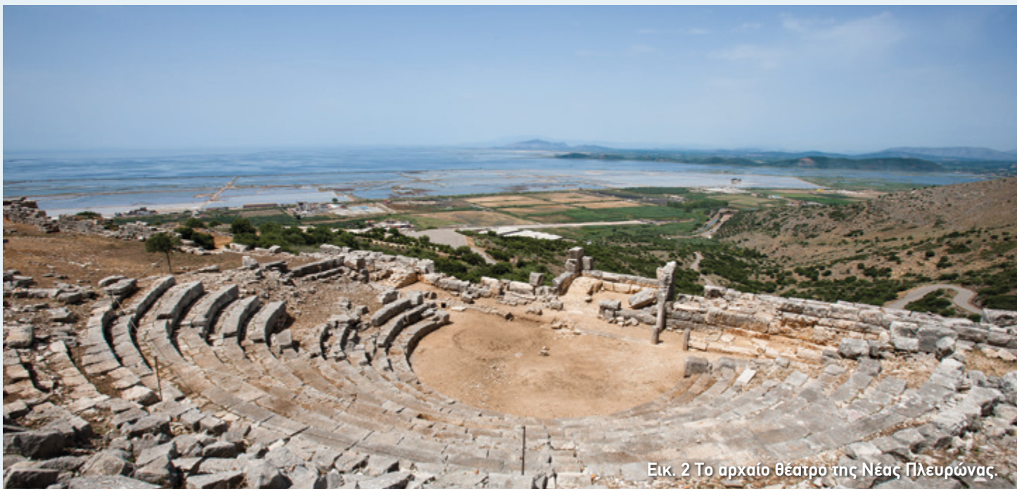
Εικ. 2 Το αρχαίο θέατρο της Νέας Πλευρώνας.

Σύμφωνα με το μύθο, η Αιτωλία πήρε το όνομά της από τον Αιτωλό, απόγονο του Δία που ήρθε από την Ηλεία και εγκαταστάθηκε στον τόπο αυτό. Η περιοχή κατοικήθηκε από τα προϊστορικά χρόνια, ενώ πολλοί οικισμοί αναπτύχθηκαν στη μυκηναϊκή εποχή. Στην Ιλιάδα γίνεται λόγος για πέντε πόλεις της Αιτωλίας, οι οποίες πήραν μέρος στον Τρωικό πόλεμο. Μία από αυτές ήταν η Πλευρώνα με σαράντα πλοία και επικεφαλής το βασιλιά Θόα.