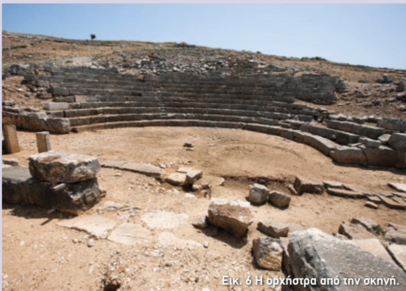
Εικ. 6 Η ορχήστρα από την σκηνή.