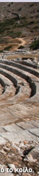
ό το κοίλο.

Στη δεξιά πλευρά του πύργου, όπως τον αντικρίζετε από το κοίλο, υπήρχε μία μικρή πύλη που οδηγούσε έξω από το θέατρο. Βγαίνοντας κανείς από εκεί βρισκόταν πια εκτός των τειχών της πόλης. Στην άλλη πλευρά της σκηνής, εκείνη που αντίκριζαν οι θεατές, υπήρχε το προσκήνιο , μία στοά που στηριζόταν σε κίονες (εικ. 4, 5). Ανάμεσά τους τοποθετούσαν ζωγραφικούς πίνακες που λειτουργούσαν ως σκηνικά των παραστάσεων. Στο κέντρο του προσκηνίου ανοιγόταν μία θύρα που οδηγούσε στην ορχήστρα (εικ. 4). Ακόμη, ένα ξύλινο πατάρι που στηριζόταν στο προσκήνιο αποτελούσε το λογείο . Εκεί έπαιζαν οι υποκριτές, οι οποίοι εμφανίζονταν από τις πόρτες που υπήρχαν στον τοίχο της σκηνής (εικ. 4).