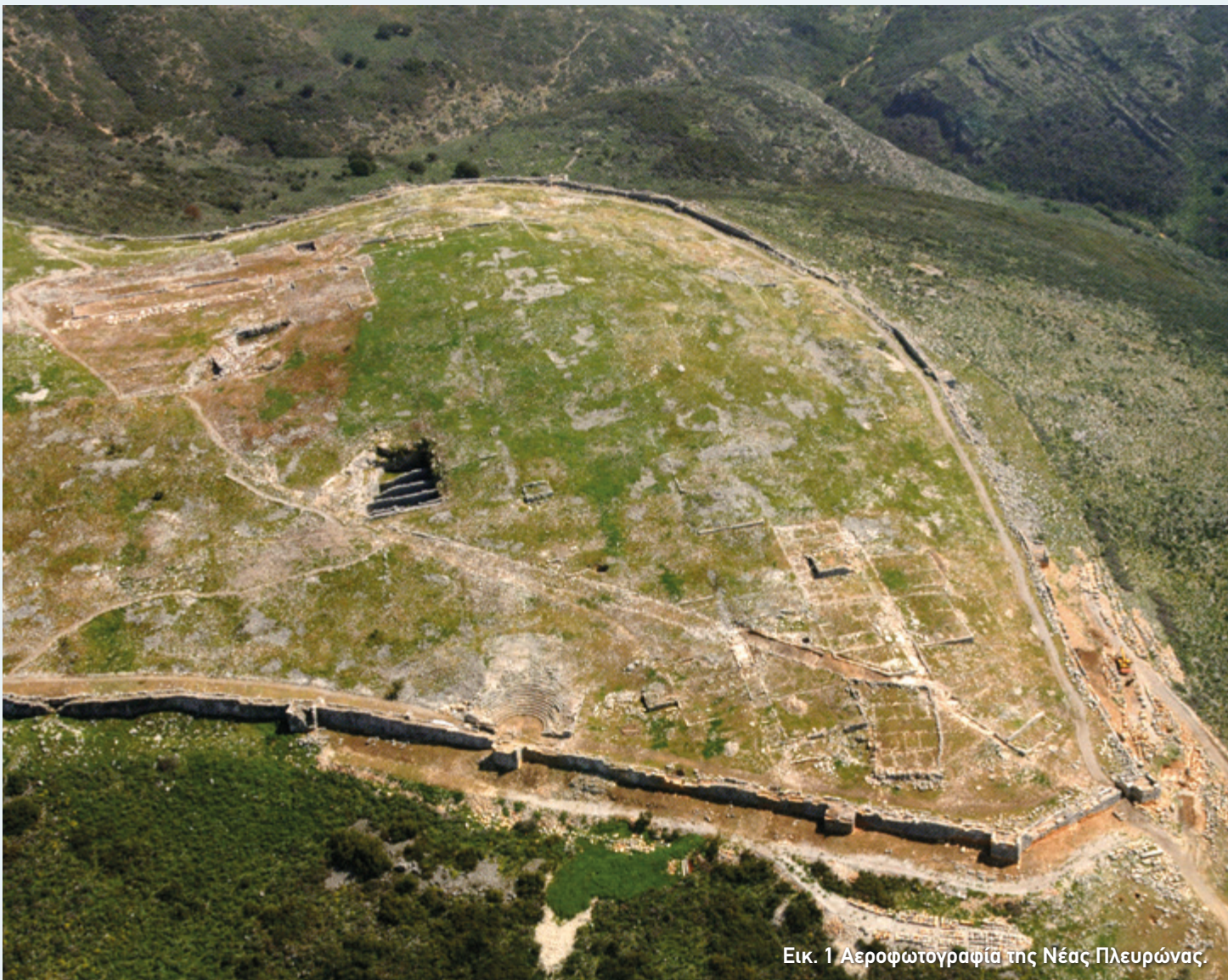
Εικ. 1 Αεροφωτογραφία της Νέας Πλευρώνας.