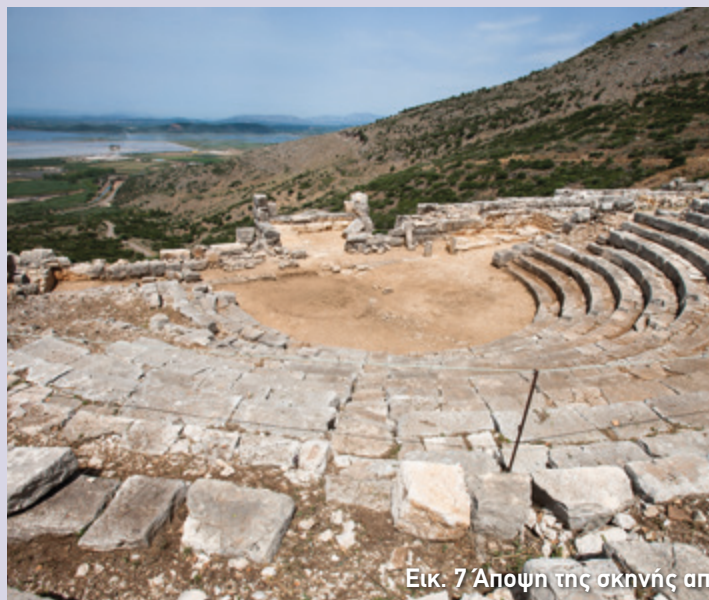
Εικ. 7 Άποψη της σκηνής από