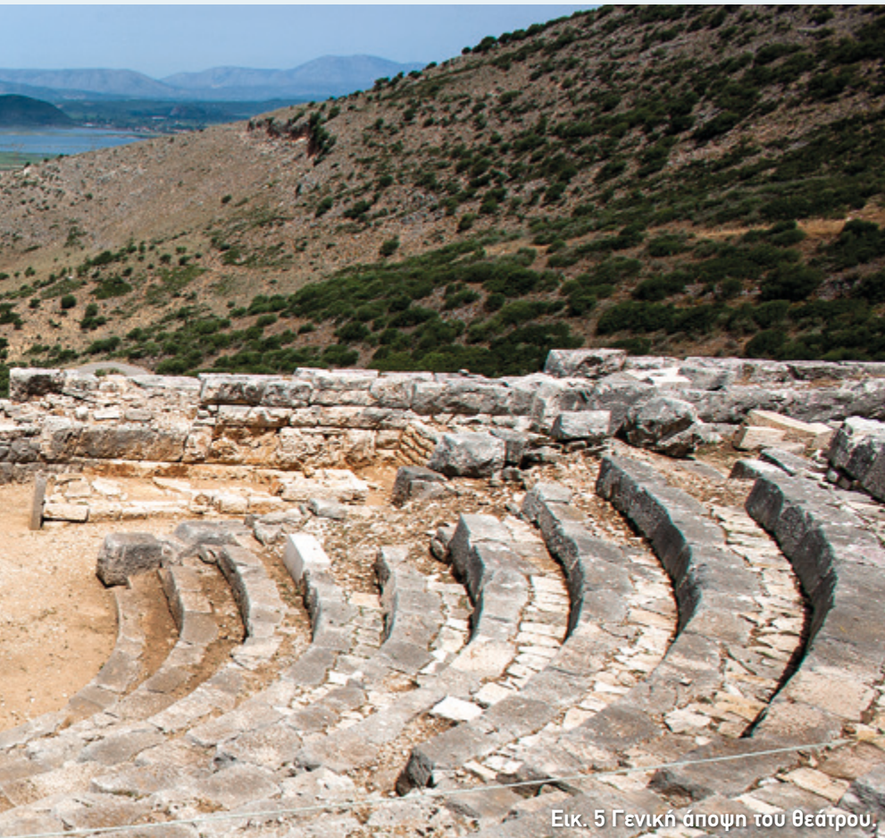
Εικ. 5 Γενική άποψη του θεάτρου.