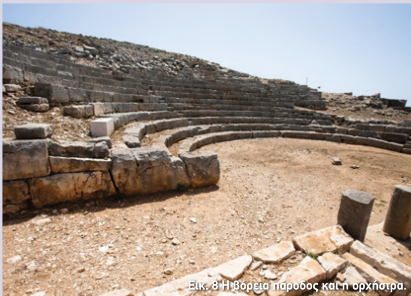
Εικ. 8 Η βόρεια πάροδος και η ορχήστρα.