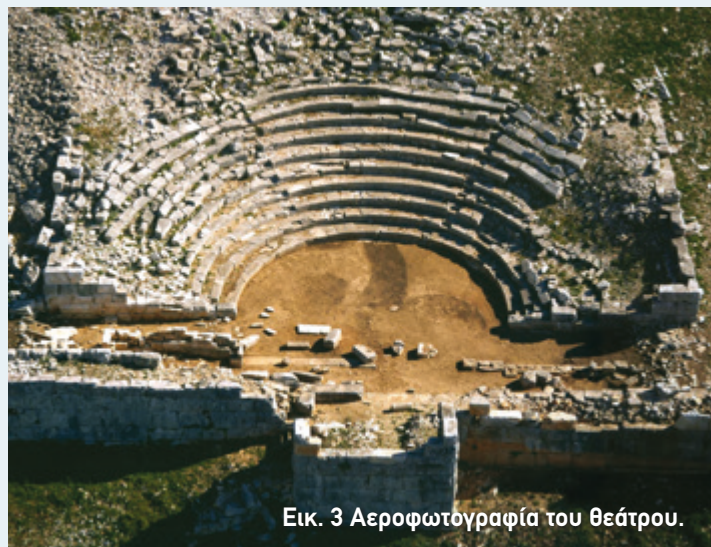
Εικ. 3 Αεροφωτογραφία του θεάτρου.

Στα χρόνια που ακολούθησαν η Αιτωλική Συμπολιτεία αποδυναμώθηκε και οι Αιτωλοί βρέθηκαν σταδιακά κάτω από τον έλεγχο των Ρωμαίων. Καθοριστικό ρόλο για την τύχη της περιοχής έπαιξε