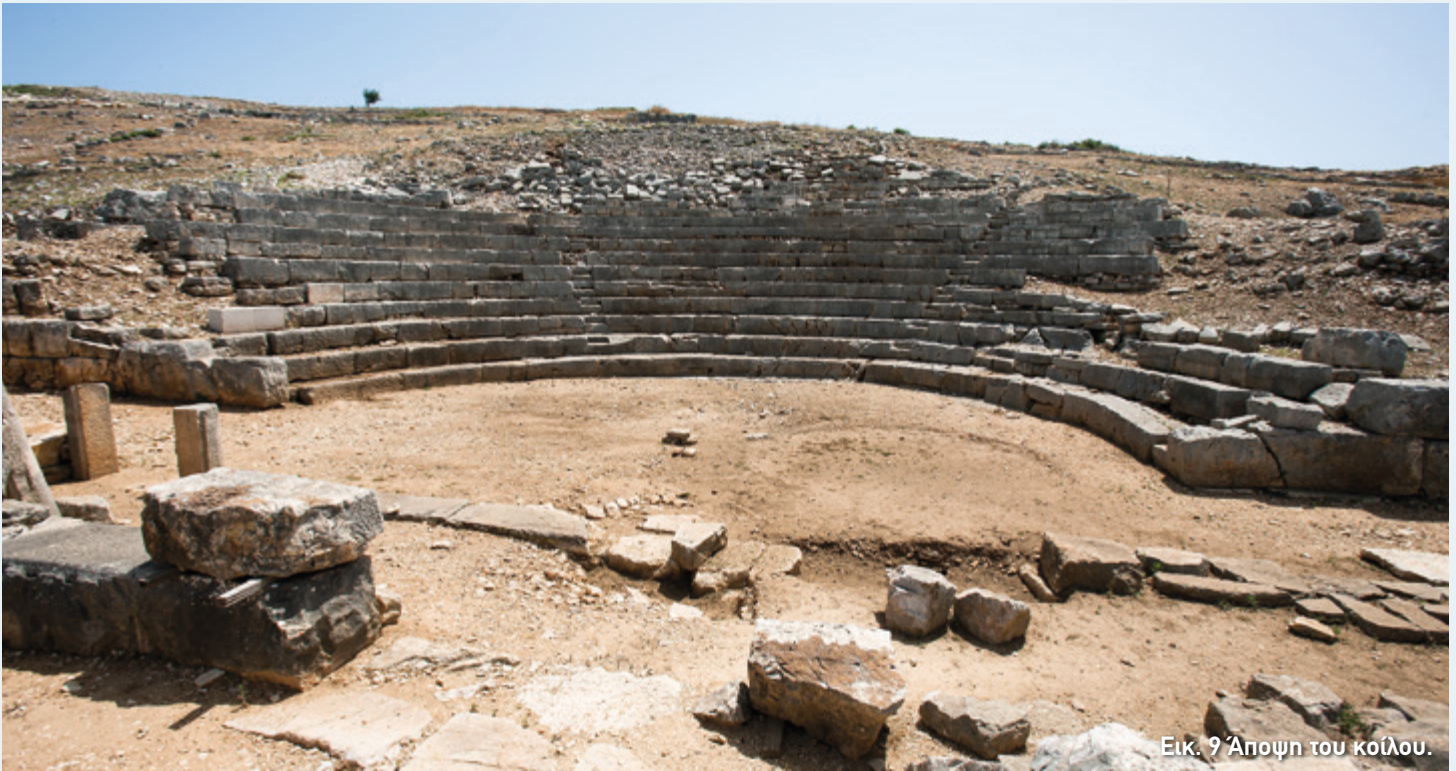
Εικ. 9 Άποψη του κοίλου.

Όπως θα παρατηρήσετε, το κοίλο χωρίζεται σε τρία κάθετα τμήματα, τις κερκίδες . Στην πρώτη σειρά εδωλίων, περίπου στο μέσο κάθε κερκίδας, είχαν προβλεφθεί θέσεις για τους επισήμους, οι προεδρίες , όπως ονομάζονται. Αν και σήμερα δεν σώζονται, οι αρχαιολόγοι εντόπισαν τη θέση τους από κάποια λαξεύματα που υπήρχαν εκεί.