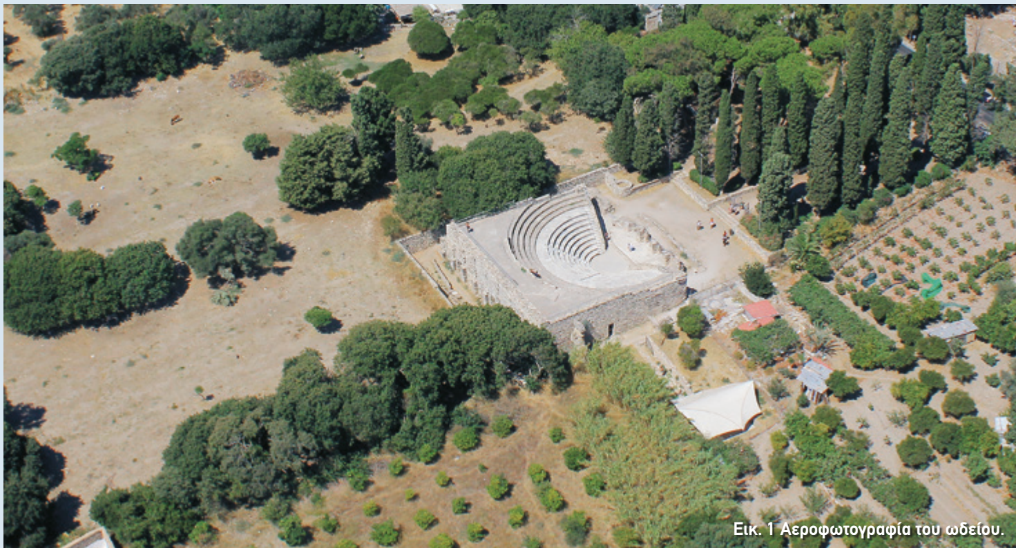
Εικ. 1 Αεροφωτογραφία του ωδείου.