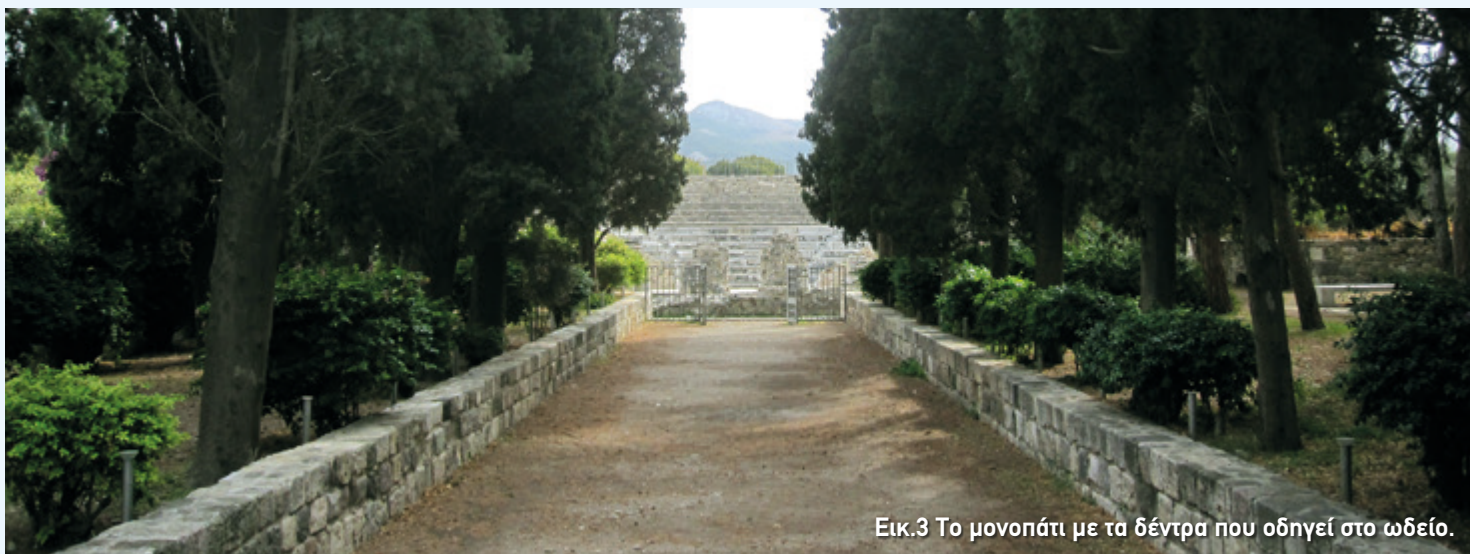
Εικ.3 Το μονοπάτι με τα δέντρα που οδηγεί στο ωδείο.