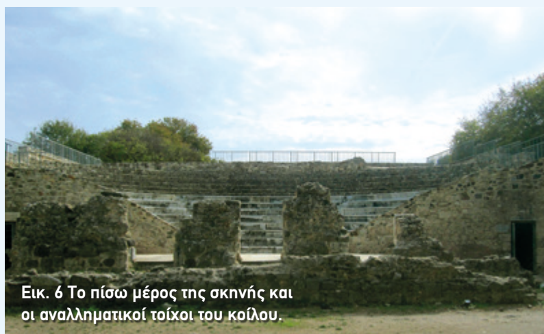
Εικ. 6 Το πίσω μέρος της σκηνής και οι αναλληματικοί τοίχοι του κοίλου.