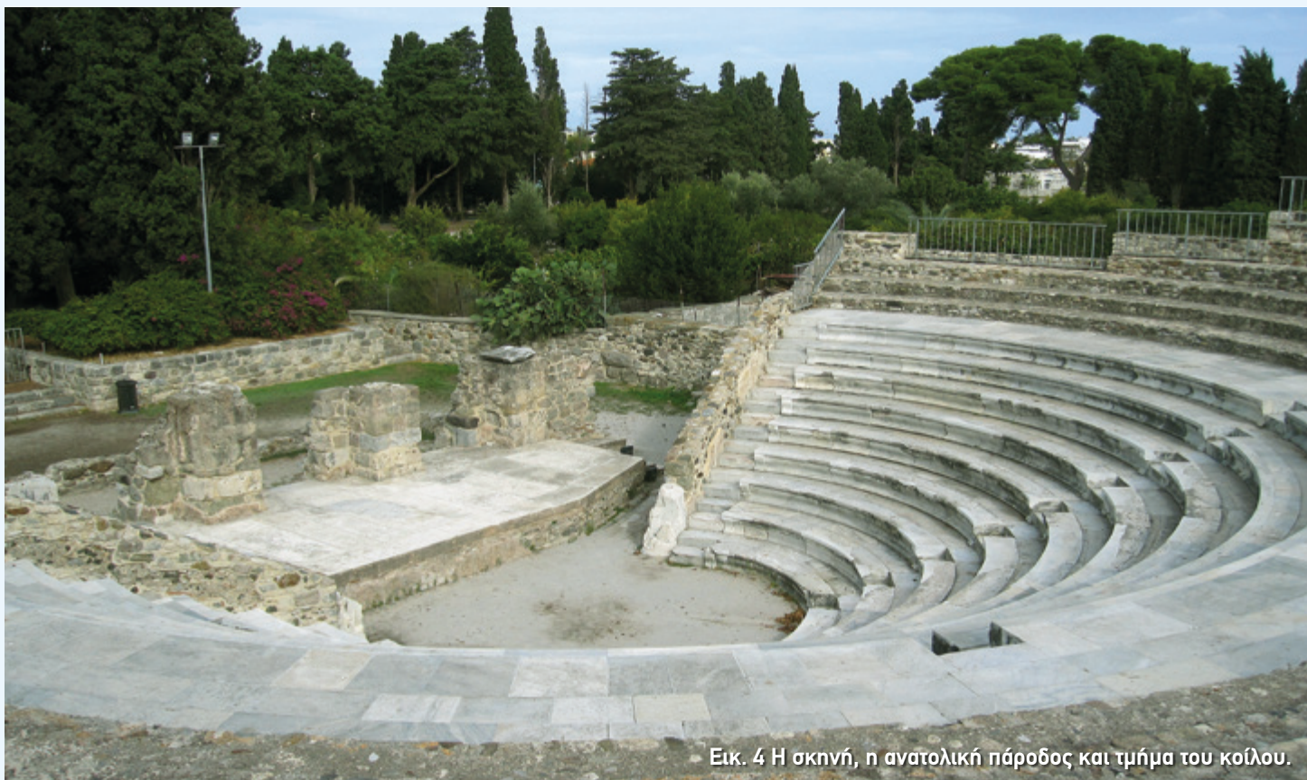
Εικ. 4 Η σκηνή, η ανατολική πάροδος και τμήμα του κοίλου.