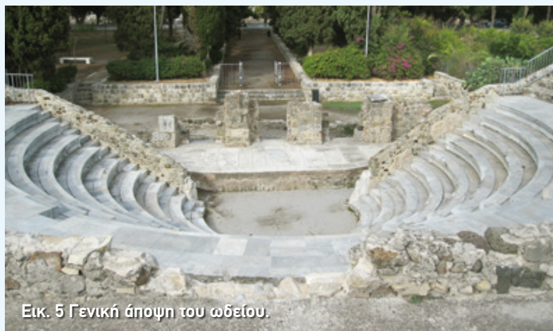
Εικ. 5 Γενική άποψη του ωδείου.

Επειδή το ωδείο είναι χτισμένο σε επίπεδο έδαφος και όχι στην πλαγιά κάποιου λόφου, το κοίλο του έπρεπε να στηριχτεί σε ισχυρούς τοίχους. Κάποιοι από αυτούς είναι ορατοί εξωτερικά, όπως οι δύο τοίχοι που στηρίζουν τα άκρα του και λέγονται αναλληματικοί (εικ. 6). Κάποιους άλλους όμως δεν τους βλέπουμε γιατί βρίσκονται στην υποδομή του κοίλου. Εκεί, λοιπόν, υπάρχει μια σειρά τοίχων που δημιουργούν τη βάση, πάνω στην οποία στηρίζεται το κοίλο. Μάλιστα, οι τοίχοι αυτοί ενώνονται μεταξύ τους με καμάρες και δημιουργούν στοές, διαδρόμους και δωμάτια. Έτσι, το κοίλο μοιάζει σαν να στηρίζεται σε έναν μικρό λαβύρινθο, τον οποίο, μάλιστα, μπορείτε να επισκεφθείτε! Θα σας οδηγήσει εκεί μία από τις δύο εισόδους που ανοίγονται στους αναλληματικούς τοίχους. Στο εσωτερικό του, λοιπόν, σήμερα φιλοξενείται μία έκθεση για την ιστορία του ωδείου. Στα ρωμαϊκά χρόνια όμως τα πέντε δωμάτια στο πίσω μέρος του κοίλου στέγαζαν καταστήματα. Φαίνεται, μάλιστα, ότι στον εξωτερικό τοίχο του κοίλου ανοίγονταν εισοδοί που οδηγούσαν στα καταστήματα αυτά από το δρόμο που περνούσε πίσω από το ωδείο.