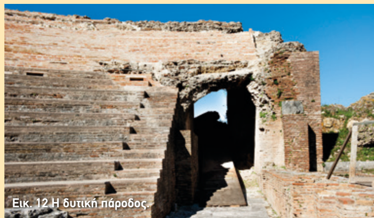
Εικ. 12 Η δυτική πάροδος.