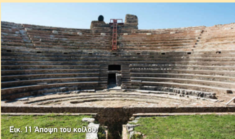
Εικ. 11 Άποψη του κοίλου.