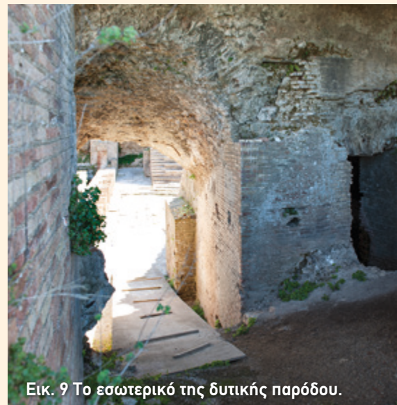
Εικ. 9 Το εσωτερικό της δυτικής παρόδου.