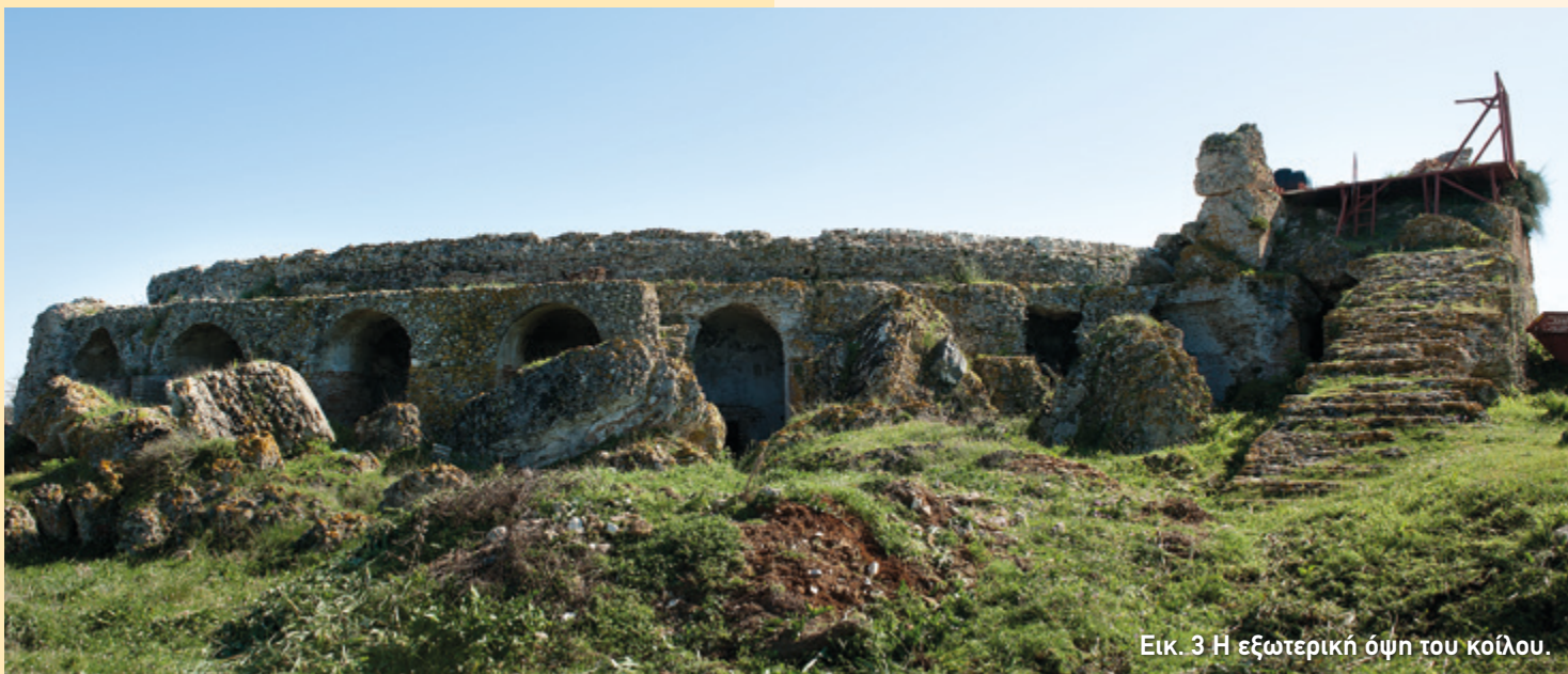
Εικ. 3 Η εξωτερική όψη του κούλου.