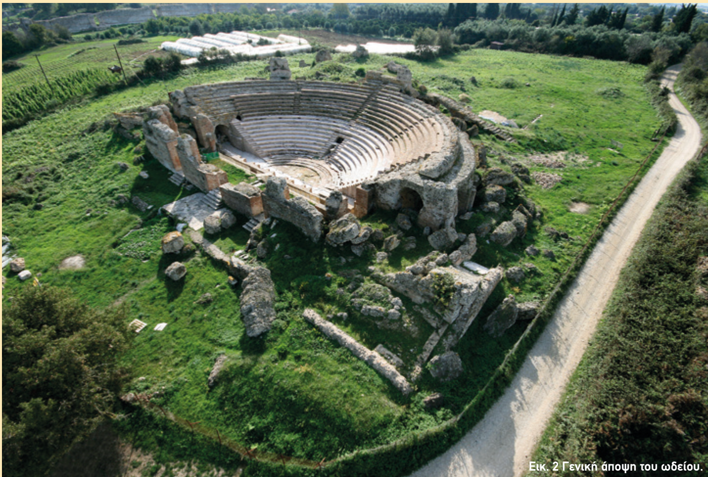
Εικ. 2 Γενική άποψη του ωδείου.