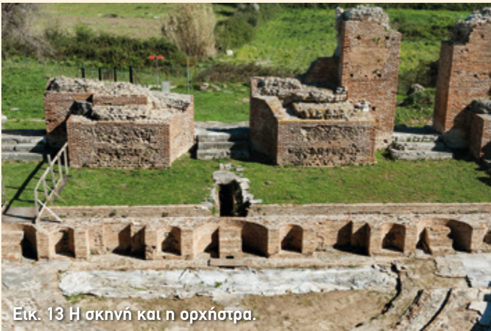
Εικ. 13 Η σκηνή και η ορχήστρα.

Στις άκρες του λογείου υπήρχαν πόρτες που οδηγούσαν σε δύο τετράγωνα δωμάτια, τα παρασκήνια . Αυτά χρησίμευαν ως αποθηκευτικοί χώροι ή ως χώροι προετοιμασίας των πρωταγωνιστών. Στην εξωτερική πλευρά των παρασκηνίων βρισκόνταν οι κλίμακες που, όπως είδαμε, οδηγούσαν στο δεύτερο όροφο της σκηνής (εικ. 6). Στην πλευρά του λογείου που συνορεύει με την ορχήστρα, θα παρατηρήσετε μία τάφρο, δηλαδή ένα μακρόστενο άνοιγμα (εικ. 13). Εκεί φυλασσόταν η αυλαία που με έναν ειδικό μηχανισμό ανέβαινε από κάτω προς τα πάνω, αντίθετα δηλαδή απ' ό,τι συμβαίνει σήμερα στα θέατρα. Πίσω από την τάφρο της αυλαίας μπορείτε να δείτε τον υπόγειο αγωγό που συγκέντρωνε τα νερά της βροχής από το άνοιγμα στο κέντρο της ορχήστρας και τα διοχέτευε έξω από το ωδείο.