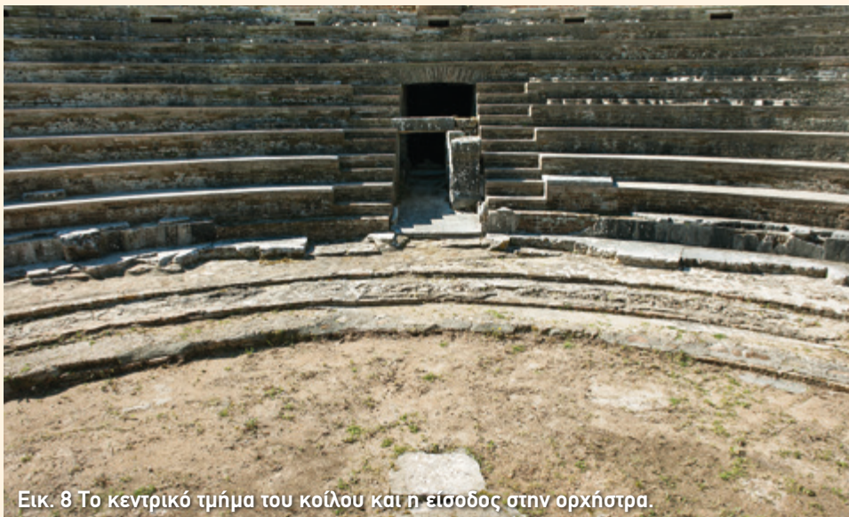
Εικ. 8 Το κεντρικό τμήμα του κοίλου και η είσοδος στην ορχήστρα.