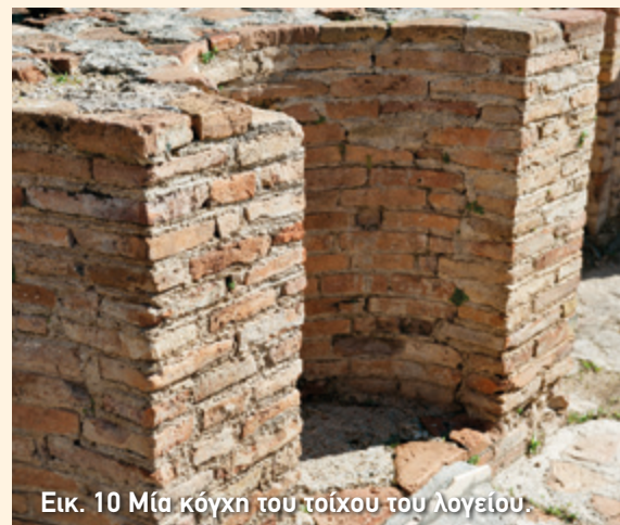
Εικ. 10 Μία κόγχη του τοίχου του λογείου.

Αν σταθείτε στην ορχήστρα με την πλάτη σας στραμμένη στο κοίλο, θα παρατηρήσετε έναν χαμηλό τοίχο διακοσμημένο με κόγχες, δηλαδή εσοχές που άλλες είναι ημικυκλικές και άλλες ορθογώνιες (εικ. 10). Μάλιστα στις τρεις μεγαλύτερες υπάρχουν σκάλες που συνδέουν την ορχήστρα με τη σκηνή του ωδείου (εικ. 13).