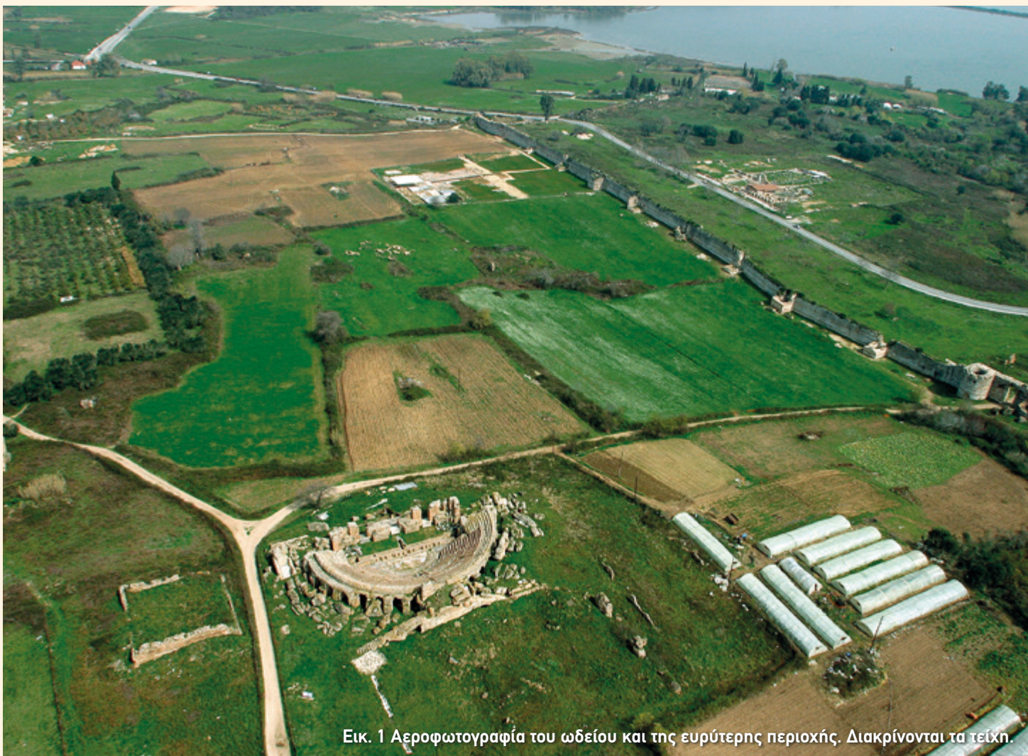
Εικ. 1 Αεροφωτογραφία του ωδείου και της ευρύτερης περιοχής. Διακρίνονται τα τείχη.