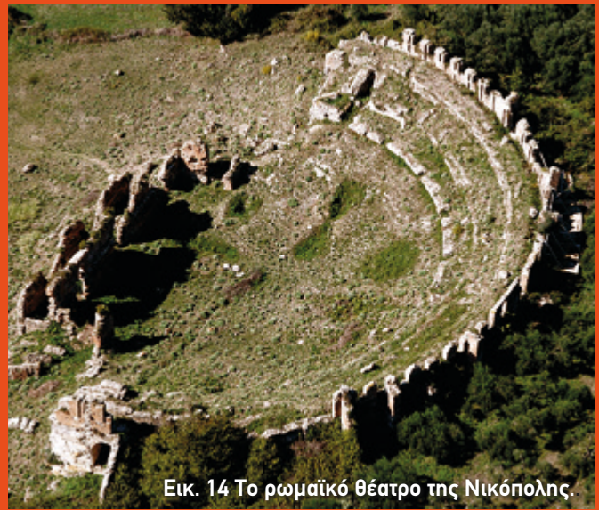
Εικ. 14 Το ρωμαϊκό θέατρο της Νικόπολης.