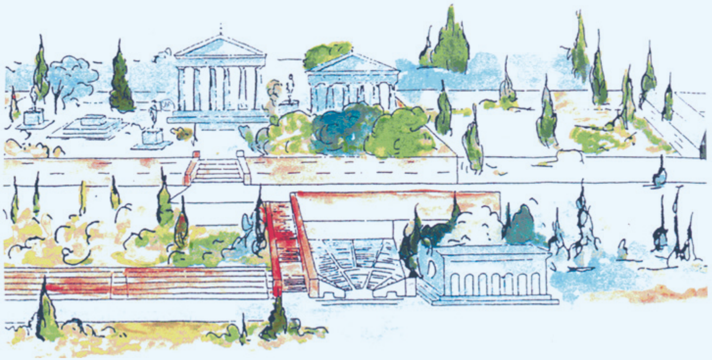
Εικ. 1 Αναπαράσταση της ακρόπολης της Ρόδου. Στο πρώτο επίπεδο διακρίνεται στο κέντρο το ωδείο και ακριβώς αριστερά μέρος του Σταδίου.