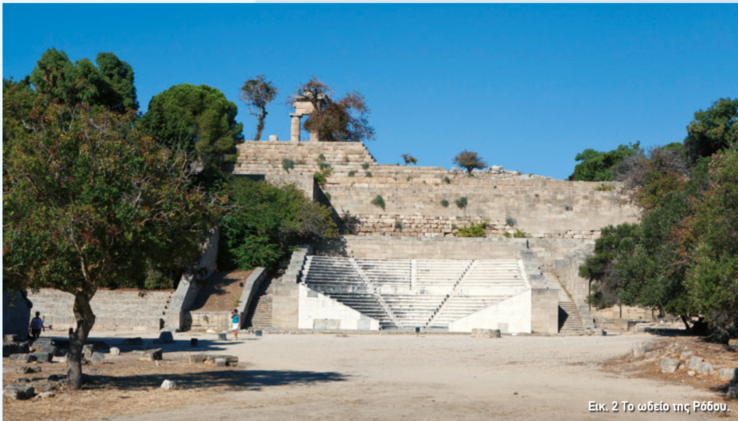
Εικ. 2 Το ωδείο της Ρόδου.

των τεχνών. Σπουδαίοι πνευματικοί άνθρωποι και καλλιτέχνες έζησαν κι εργάστηκαν στη Ρόδο, όπως γλύπτες που δημιούργησαν ονομαστά έργα της αρχαιότητας. Ανάμεσά τους και ο Χάρης, μαθητής του διάσημου γλύπτη Λύσιππου, ο οποίος φιλοτέχνησε ένα από τα επτά θαύματα της αρχαιότητας, το περίφημο χάλκινο άγαλμα του Ήλιου, γνωστό ως «ο Κολοσσός της Ρόδου». Κι ενώ οι περισσότερες πόλεις της εποχής αυτής αποτελούσαν τμήματα ισχυρών μοναρχιών, στη Ρόδο οι δημοκρατικοί θεσμοί της κλασικής περιόδου, όπως η εκκλησία του δήμου και η βουλή, παρέμειναν σε ισχύ.