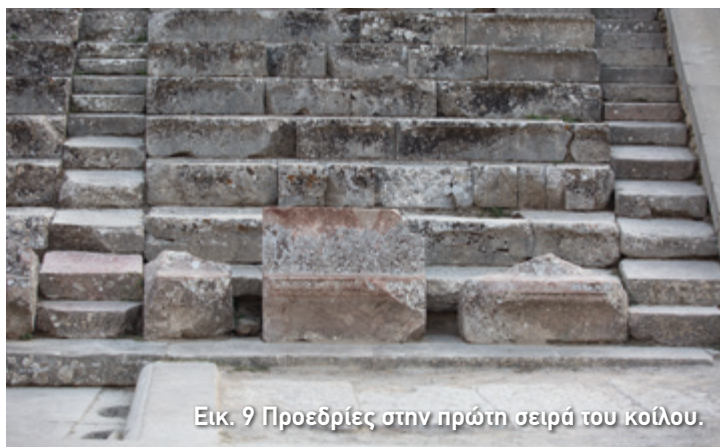
Εικ. 9 Προεδρίες στην πρώτη σειρά του κοίλου.