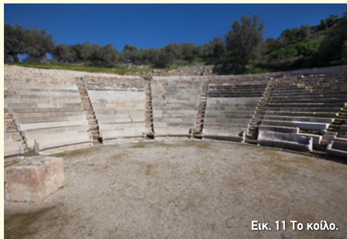
Εικ. 11 Το κοίλο.