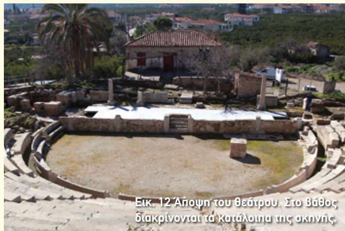
Εικ. 12 Άποψη του θεάτρου. Στο βάθος διακρίνονται τα κατάλοιπα της σκηνής.