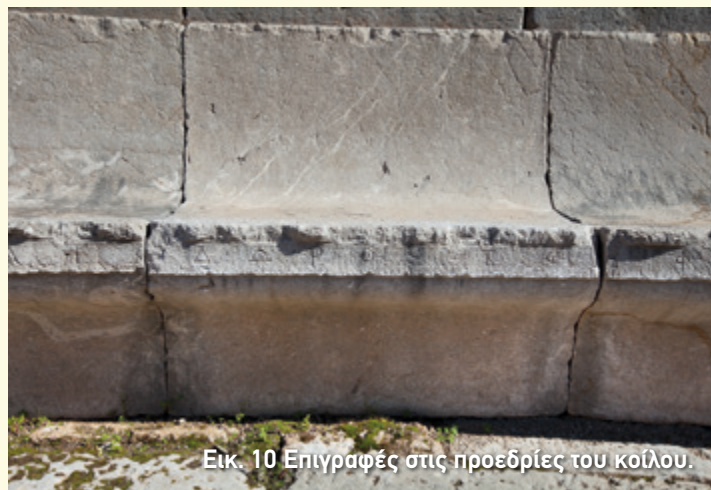
Εικ. 10 Επιγραφές στις προεδρίες του κοίλου.

Την πρώτη σειρά κάθε κερκίδας κατέλαβαν οι προεδρίες, τα τιμητικά καθίσματα, δηλαδή, για τους επισήμους (εικ. 10, 11). Έχουν στήριγμα για την πλάτη και στα άκρα της κερκίδας στηρίγματα για τα χέρια. Τα καθίσματα όμως στις υπόλοιπες σειρές, τα οποία προορίζονταν για τους απλούς πολίτες, δεν έχουν ενιαία μορφή. Κάποια είναι πιο πρόχειρα φτιαγμένα με τη μορφή απλών τετράγωνων λίθων, ενώ άλλα τα επιμελήθηκαν περισσότερο δημιουργώντας μία εσοχή στο κάτω μέρος, για να τραβούν οι θεατές τα πόδια τους και να ξεκουράζονται. Όπως είδαμε παραπάνω, αυτό ήταν αποτέλεσμα της τμηματικής κατασκευής του κοίλου. Ανάλογα, δηλαδή, με τα διαθέσιμα χρήματα, η κατασκευή των εδωλίων ήταν άλλοτε πιο φροντισμένη κι άλλοτε πιο πρόχειρη.