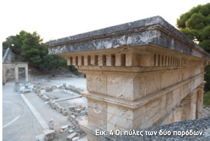
Εικ. 4 Οι πύλες των δύο παρόδων.

Αν και χρησιμοποιήθηκε τουλάχιστον ως τον 3ο αι. μ.Χ., είχε την τύχη, αντίθετα με άλλα θέατρα, να μην υποστεί πολλές αλλαγές στο πέρασμα του χρόνου. Έτσι, στο θέατρο της Επιδαύρου μπορεί κανείς σήμερα να κατανοήσει τη μορφή των ελληνικών θεάτρων.