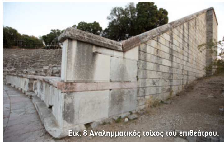
Εικ. 8 Αναλημματικός τοίχος του επιθέατρου.

Η εξαιρετική ακουστική του θεάτρου οφείλεται στον πρωτότυπο τρόπο με τον οποίο σχεδιάστηκε το κοίλο, κάνοντάς το να μοιάζει με ένα τεράστιο κωνί, ικανό να απορροφήσει κάθε ήχο που βγαίνει από την ορχήστρα. Για να το διαπιστώσετε, μπορείτε να δοκιμάσετε ένα πείραμα. Καθίστε στο ψηλότερο σημείο του ενώ ένας από εσάς στο κέντρο της ορχήστρας ας ρίξει ένα κέρμα ή ας πει μία λέξη. Το αποτέλεσμα θα σας εντυπωσιάσει! Σκεφτείτε πόσο καθαρότερα θα ακούγονταν όλα αν υπήρχε και η σκηνή για να συγκρατεί τους ήχους!