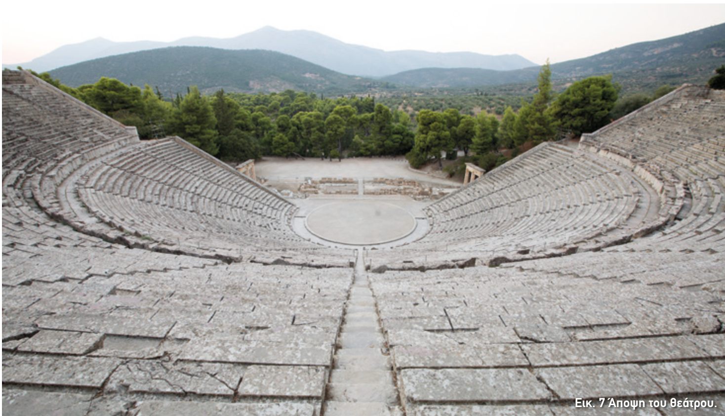
Εικ. 7 Άποψη του θεάτρου.

Πάντως, το σκηνικό οικοδόμημα απέκτησε αυτή τη διαμόρφωση μόλις τον 2ο αι. π.Χ. Όταν κατασκευάστηκε το θέατρο, η σκηνή ήταν μονώροφη και αρκετά πιο λιτή.