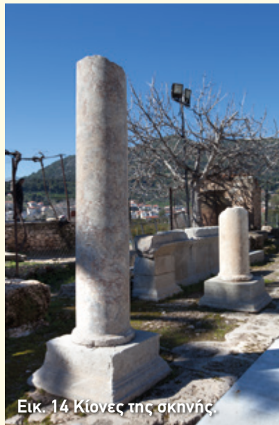
Εικ. 14 Κίονες της σκηνής.

Μπορεί μόνο το κατώτερο τμήμα να σώζεται σήμερα από το κτήριο της σκηνής που έχτισαν οι Ρωμαίοι, είναι όμως αρκετά βοηθητικό για να φανταστούμε τη μορφή που θα είχε στην αρχαιότητα (εικ. 12). Στο πίσω μέρος υπωνόταν το κυρίως κτήριο της σκηνής.