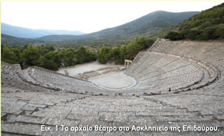
Εικ. 1 Το αρχαίο θέατρο στο Ασκληπιείο της Επίδαυρου.

Αν και πόλη μικρή, η Επίδαυρος είχε το δικό της θέατρο, ξεχωριστό και διαφορετικό από αυτό του ιερού. Χτίστηκε λίγο νωρίτερα από τα τέλη του 4ου αι. π.Χ., όταν οικοδομήθηκε το θέατρο στο Ασκληπιείο. Ήταν όμως πολύ μικρότερο και πολύ πιο πρόχειρα φτιαγμένο. Ήταν αφιερωμένο στον θεό Διόνυσο. Καθώς όμως ήταν χτισμένο μέσα στον ιστό της πόλης δεν φιλοξένησε μόνο τα δρώμενα της διονυσιακής λατρείας και παραστάσεις δράματος, αλλά και πολιτικές συγκεντρώσεις.