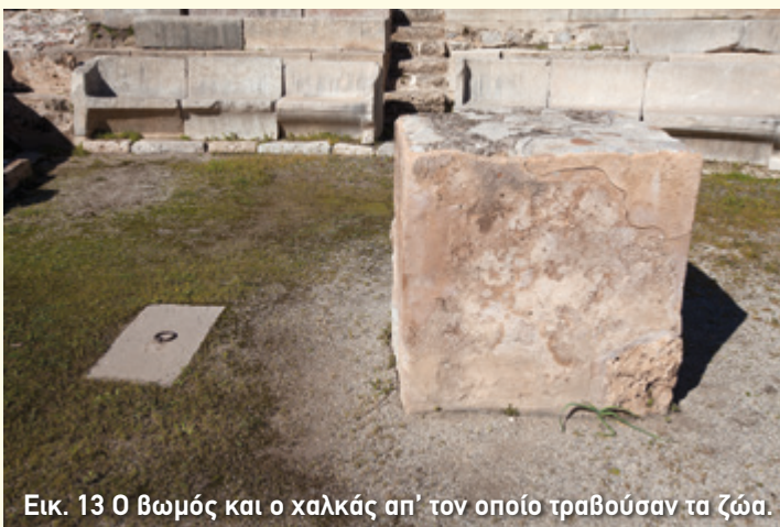
Εικ. 13 Ο βωμός και ο χαλκός απ' τον οποίο τραβούσαν τα ζώα.