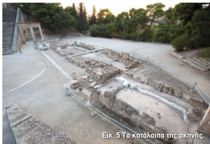
Εικ. 5 Τα κατάλοιπα της σκηνής.