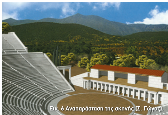
Εικ. 6 Αναπαράσταση της σκηνής (Σ. Γώγος).