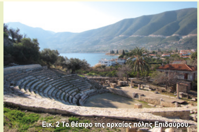
Εικ. 2 Το θέατρο της αρχαίας πόλης Επίδαυρου.