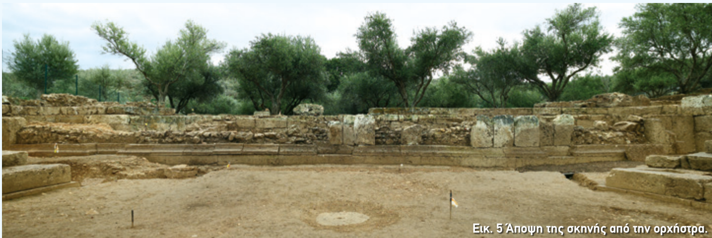
Εικ. 5 Άποψη της σκηνής από την ορχήστρα.