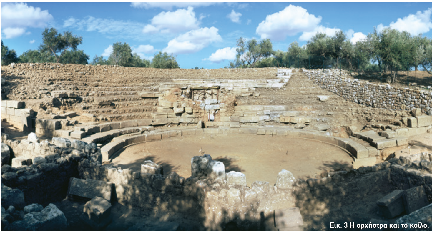
Εικ. 3 Η ορχήστρα και το κοίλο.