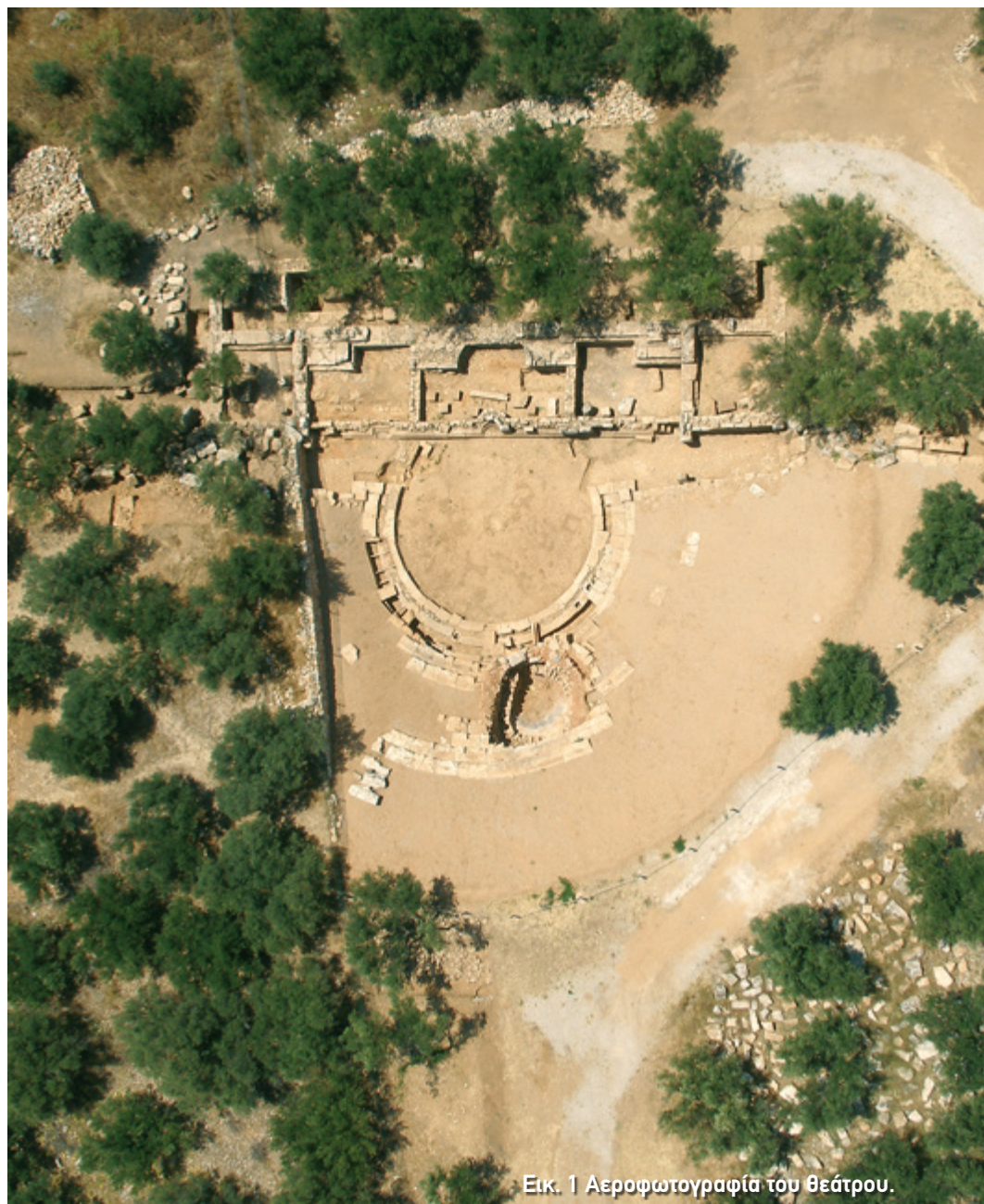
Εικ. 1 Αεροφωτογραφία του θεάτρου.

Έτσι έχουν ονομάσει την Απτέρα ορισμένοι ερευνητές, επειδή κάποια από τα κτήρια της αρχαίας πόλης σώζονται σε αρκετά μεγάλο ύψος μέχρι και σήμερα. Τα πιο εντυπωσιακά από αυτά είναι οι δεξαμενές και τα λουτρά, που χτίστηκαν στα ρωμαϊκά χρόνια. Από αρχαιότερες περιόδους της πόλης, μπορείτε να δείτε τμήματα από τα τείχη, το ναό του 5ου αι. π.Χ., που ήταν αφιερωμένος στην Άρτεμη και τον Απόλλωνα, και φυσικά το θέατρο της Απτέρας.