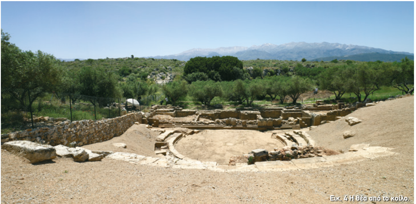
Εικ. 4 Η θέα από το κοίλο.

Στα δύο άκρα του το κοίλο στηρίζεται σε δύο ισχυρούς τοίχους κατασκευασμένους από μεγάλες πέτρες (εικ. 3). Οι τοίχοι αυτοί, που λέγονται αναλημματικοί , συγκρατούσαν τα χώματα της πλαγιάς και πρόσφεραν επιπλέον στήριξη στο κοίλο. Αν σταθείτε στην ορχήστρα και στρέψετε το βλέμμα σας στο κοίλο, θα διαπιστώσετε ότι πιο καθαρά διακρίνεται ο τοίχος στα αριστερά σας. Από τον τοίχο στα δεξιά σας φαίνεται μόνο ένα μικρό κομμάτι γιατί το υπόλοιπο δεν έχει ανασκαφεί ακόμη.