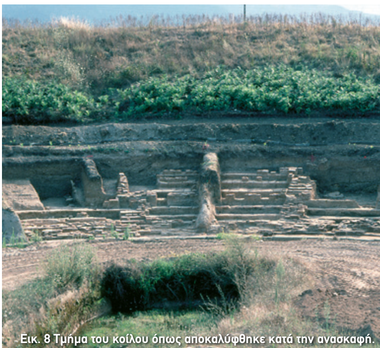
Εικ. 8 Τμήμα του κοίλου όπως αποκαλύφθηκε κατά την ανασκαφή.