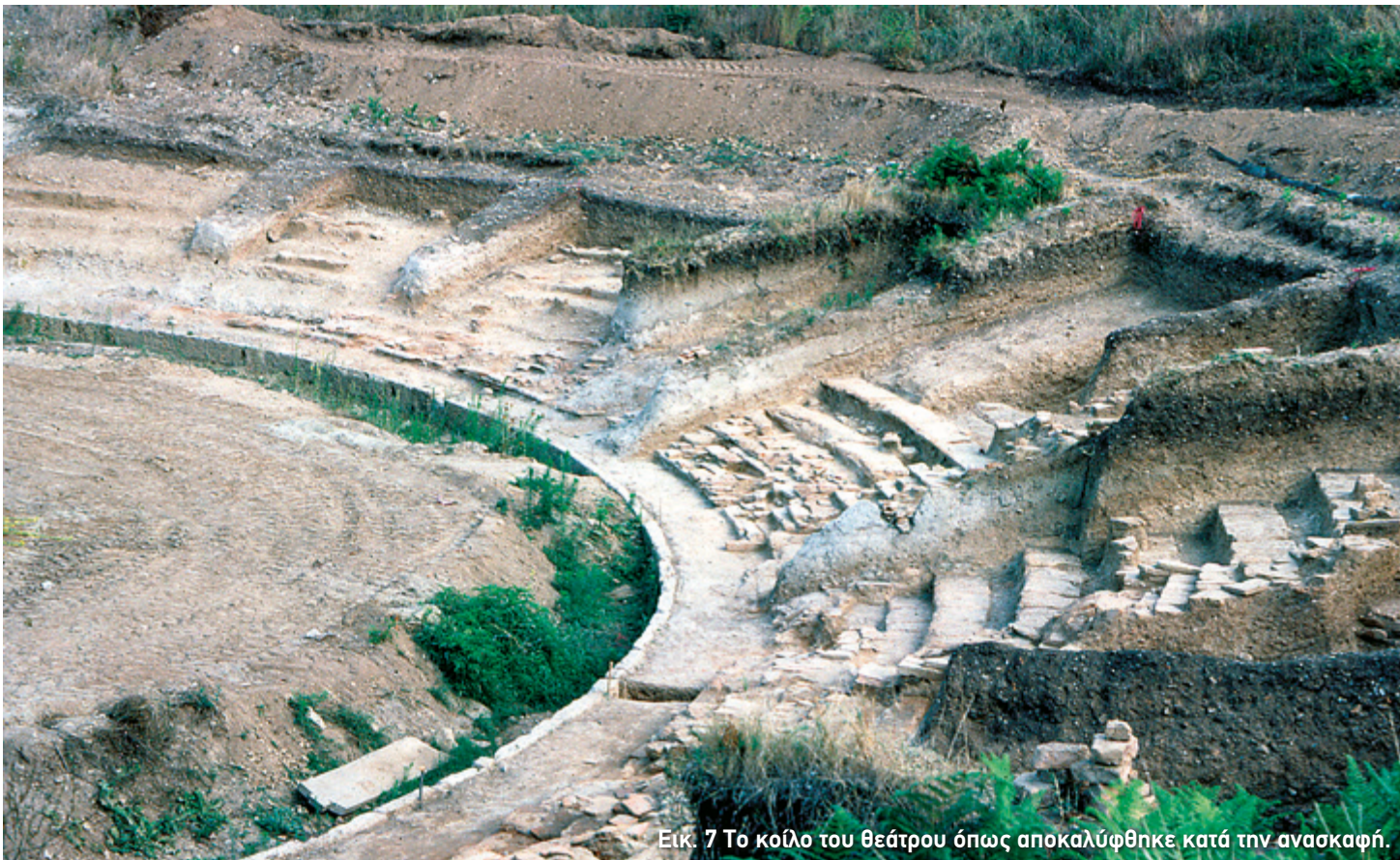
Εικ. 7 Το κοίλο του θεάτρου όπως αποκαλύφθηκε κατά την ανασκαφή.