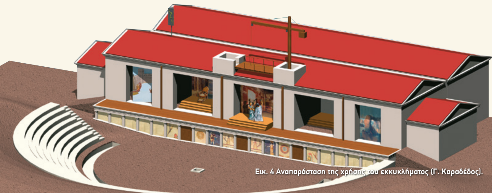
Εικ. 4 Αναπαράσταση της χρήσης του εκκύκληματος (Γ. Καραδέδος).

Στη στέγη της σκηνής είναι πιθανό να υπήρχε επίσης το κεραυνοσκοπείο , μία κατασκευή που μπορούσε να μιμηθεί την αίσθηση του κεραυνού (εικ. 5, αρ. 2). Το αποτελούσε ένας ξύλινος άξονας που συγκρατούσε πίνακες με σχέδια κεραυνών ή μεταλλικές επιφάνειες που αντανakλούσαν το φως του ήλιου. Η λειτουργία του κεραυνοσκοπείου θύμιζε αυτή των περιιάκτων, μόνο που εδώ οι πίνακες περιστρέφονταν γρήγορα, ώστε να δημιουργήσουν στους θεατές την εντύπωση ότι πέφτουν αστραπές.