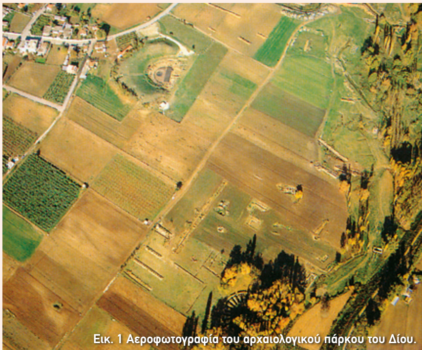
Εικ. 1 Αεροφωτογραφία του αρχαιολογικού πάρκου του Δίου.

Η πόλη δέχτηκε επίθεση και καταστράφηκε από τους Αιτωλούς το 219 π.Χ., όμως λίγο αργότερα ξαναχτίστηκε από τον Φίλιππο Ε'. Στα ρωμαϊκά χρόνια το Δίον δεν έχασε την ακτινοβολία του, αλλά εξακολούθησε να αναπτύσσεται. Τελικά η πόλη εγκαταλείφθηκε τον 5ο αι. μ.Χ. και έμεινε θαμμένη κάτω από το χώμα και την πυκνή βλάστηση μέχρι το 1928, όταν ξεκίνησαν οι πρώτες ανασκαφές.