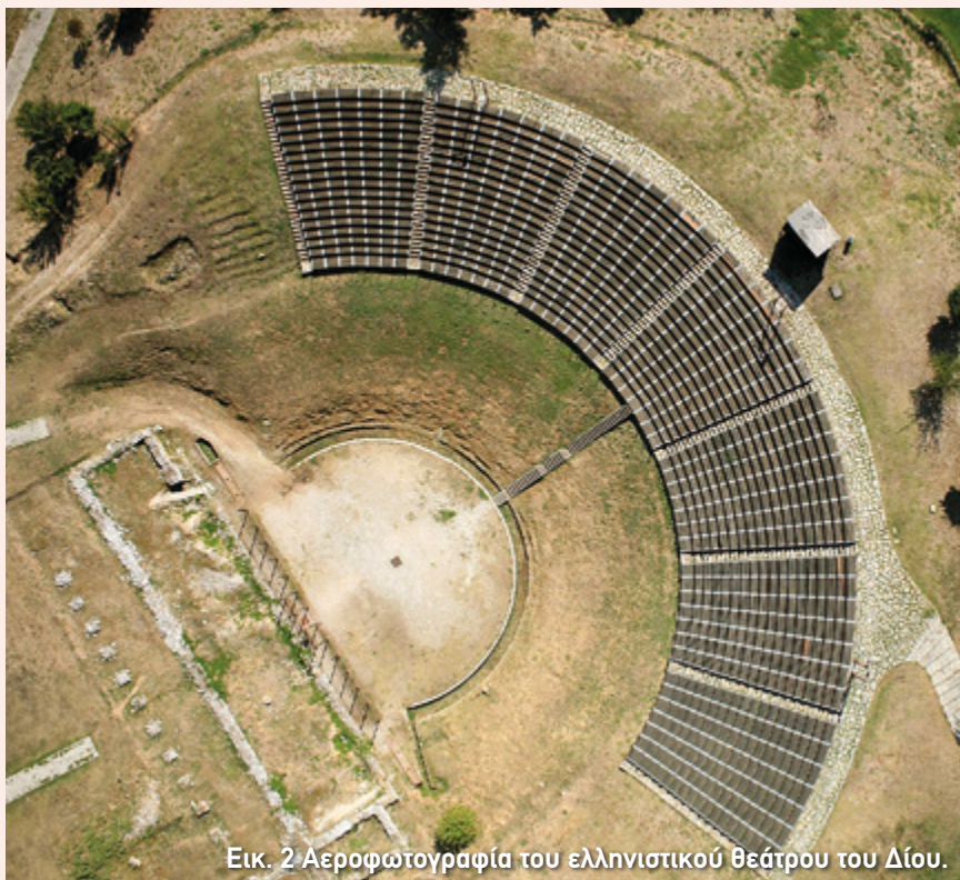
Εικ. 2 Αεροφωτογραφία του ελληνιστικού θεάτρου του Δίου.