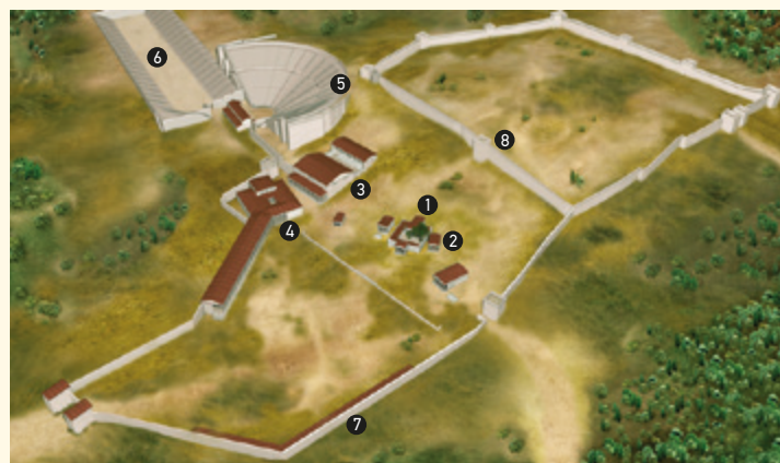
Εικ. 2 Τρισδιάστατη αναπαράσταση του ιερού τον 3ο αι. π.Χ.

Καταστράφηκε το 219 π.Χ. από τους Αιτωλούς, μία στρατιωτική και πολιτική δύναμη της κεντρικής Ελλάδας που ήθελε να επεκτα-