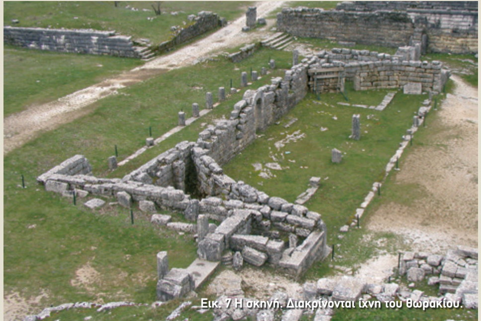
Εικ. 7 Η σκηνή. Διακρίνονται ίχνη του θωρακίου.

Στο κέντρο του τοίχου της σκηνής διατηρείται μία πύλη που οδηγούσε σε μία στοά (εικ. 8). Σήμερα στο σημείο αυτό μπο-