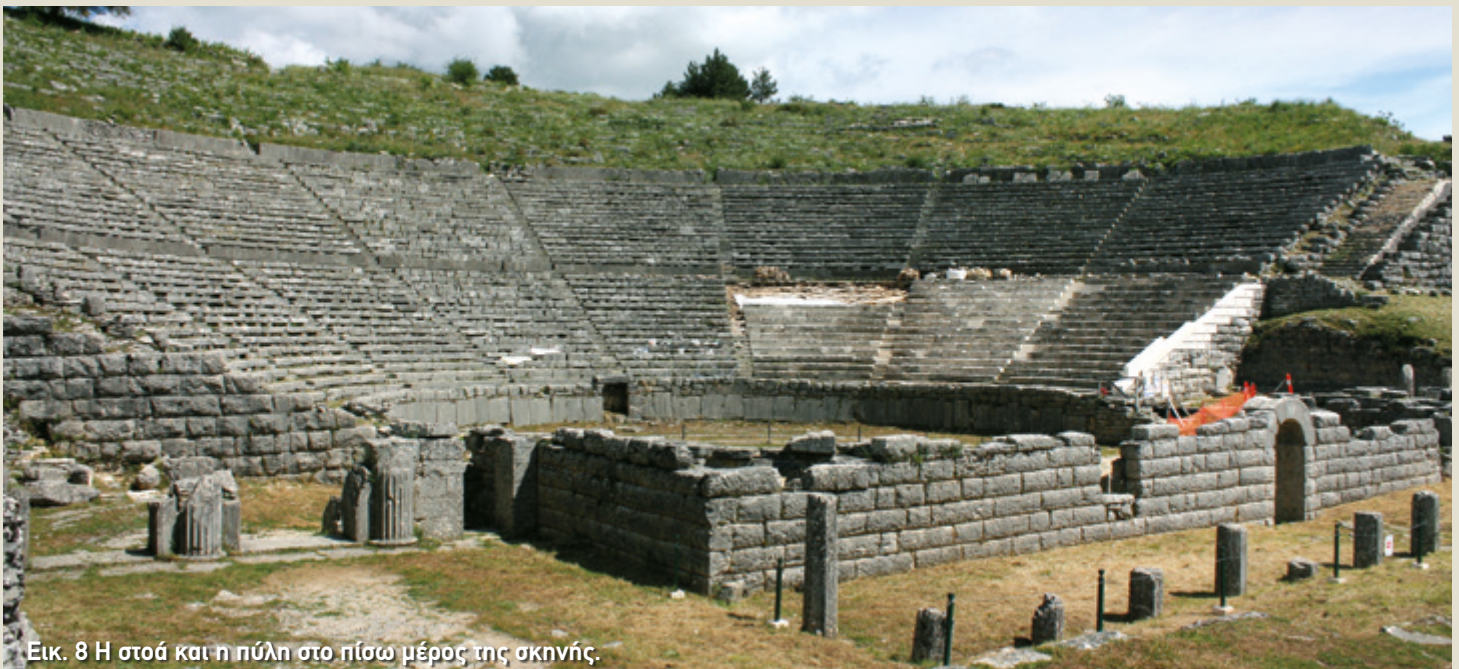
Εικ. 8 Η στοά και η πύλη στο πίσω μέρος της σκηνής.

χρήση. Την εποχή αυτή τα παρασκήνια στα δύο άκρα της διαμορφώθηκαν στα σχεδόν τριγωνικά δωμάτια που βλέπουμε σήμερα (εικ. 7). Εκεί φύλαγαν τα άγρια ζώα, όπως ταύρους και αγριόχοιρους, που έπαιρναν μέρος στις θηριομαχίες. Σώζονται, μάλιστα, οι θύρες από τις οποίες τα ζώα οδηγούνταν στην κονίστρα.