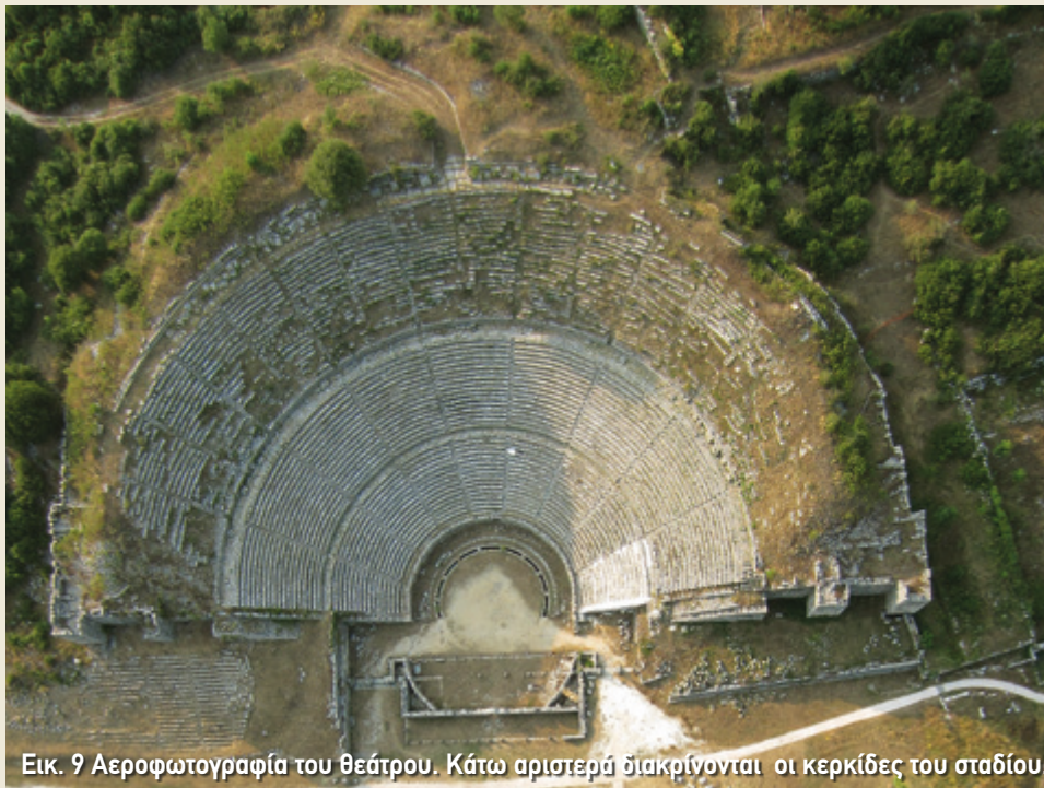
Εικ. 9 Αεροφωτογραφία του θεάτρου. Κάτω αριστερά διακρίνονται οι κερκίδες του σταδίου.

Στις πρώτες σειρές του κοίλου βρισκόταν τα καθίσματα για τους επισήμους, οι