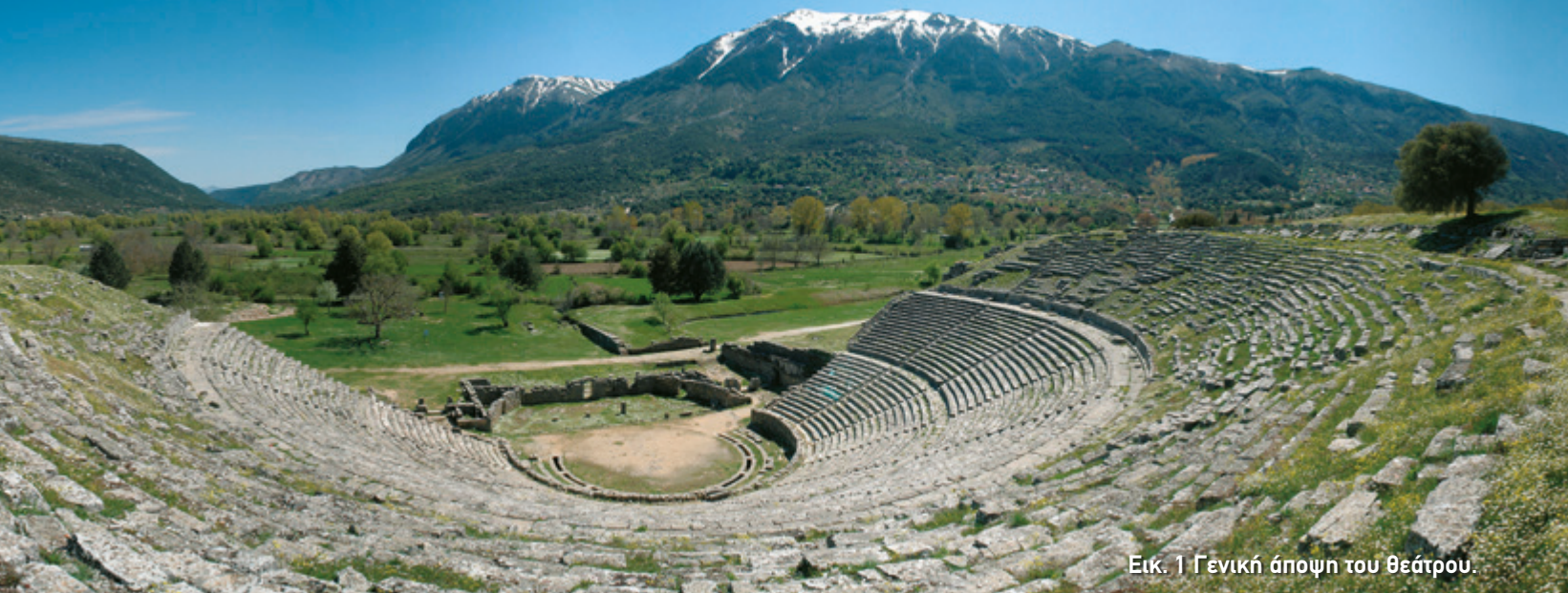
Εικ. 1 Γενική άποψη του θεάτρου.