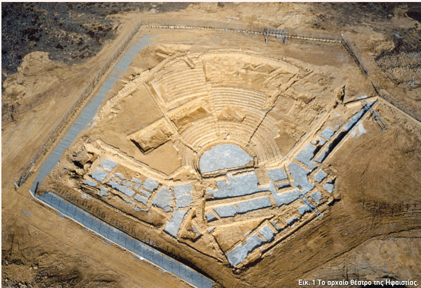
Εικ. 1 Το αρχαίο θέατρο της Ηφαιστίας.

Τ αξίδι στη βόρεια Λήμνο... Εδώ, στη χερσόνησο της Παλαιόπολης, στον κόλπο του Πουρνιά, μπορεί να δει κανείς από κοντά τα ερείπια της Ηφαιστίας, της μίας από τις δύο σημαντικότερες πόλεις της αρχαίας Λήμνου, που το όνομά της οφείλει στον προστάτη της θεό Ήφαιστο. Η άλλη ήταν η Μύρινα, στη θέση της σημερινής πρωτεύουσας, στη δυτική πλευρά του νησιού.