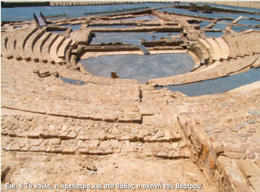
Εικ. 6 Το κοίλο, η ορχήστρα και στο βάθος η σκηνή του θεάτρου.

Τελευταία στάση στην ορχήστρα. Όπως είδαμε, οι διαδοχικές αλλαγές που έκαναν οι Ρωμαίοι στο κτήριο της σκηνής επηρέασαν το σχήμα της. Ενώ, λοιπόν, αρχικά σχημάτιζε έναν τέλειο κύκλο με διάμετρο 12, 40 μέτρα, κατέληξε να γίνει ημικυκλική. Όπως συνήθιζαν, άλλωστε, να κάνουν οι Ρωμαίοι, έστρωσαν την επιφάνειά της με λευκές πλάκες.