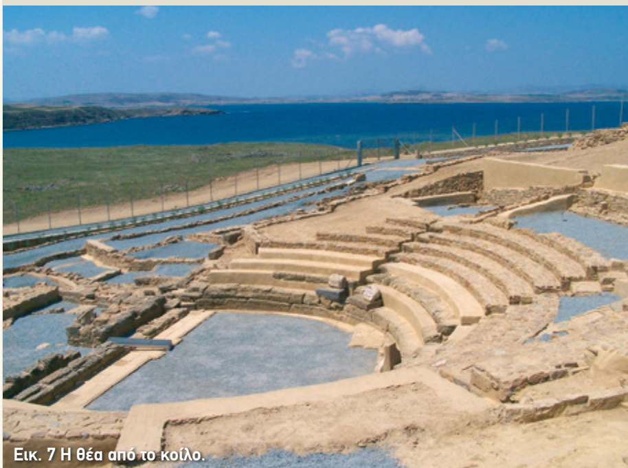
Εικ. 7 Η θέα από το κοίλο.