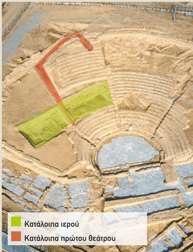
Εικ. 3 Ίχνη παλαιότερων κτηρίων.

Κ ατά τη διάρκεια των ανασκαφών ήρθαν στο φως απρόσμενα ευρήματα, αποκαλύπτοντας ότι το θέατρο της Ηφαιστίας είχε χτιστεί πάνω σε παλαιότερα οικοδομήματα διαφορετικών χρήσεων. Τα κατάλοιπά τους δίνουν μία ιδιαίτερη όψη που σίγουρα θα σας εντυπωσιάσει! Για να τα ανακαλύψετε, θα πρέπει να ανεβείτε από την ορχήστρα τη σκάλα που περνάει ανάμεσα στις δύο αριστερές κερκίδες του κοίλου και να σταθείτε περίπου στη μέση της. Από το σημείο αυτό θα διαπιστώσετε ότι στο κέντρο των δύο κερκίδων σχηματίζεται το περίγραμμα ενός παραλληλόγραμμου κτηρίου. Ήταν ένα ιερό που χτίστηκε τον 7ο αι. π.Χ. (εικ. 3). Και δεν ήταν το μόνο που βρέθηκε κάτω από το θέατρο... Στο ανώτερο σημείο της δεξιάς κερκίδας ένα ακόμη ιερό είχε χτιστεί στην αρχαϊκή εποχή (6ος αι. π.Χ.).