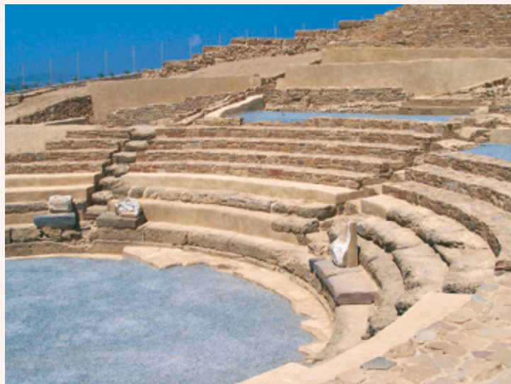
Εικ. 2 Μαρμάρινοι θρόνοι για τους επισήμους.

Όσα τμήματα του θεάτρου σώζονται σήμερα δεν προέρχονται βέβαια μόνο από το οικοδόμημα εκείνης της εποχής, αφού στην πορεία των αιώνων το θέατρο άλλαξε συνολικά πέντε φορές. Στα ελληνιστικά χρόνια μεγάλωσε, οι εντυπωσιακότερες αλλαγές όμως έγιναν στη ρωμαϊκή εποχή.