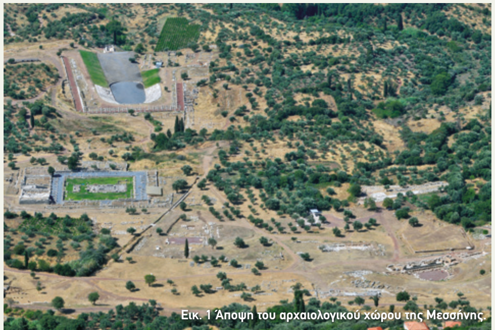
Εικ. 1 Άποψη του αρχαιολογικού χώρου της Μεσσήνης.

Η Μεσσήνη, που πήρε το όνομά της από την πρώτη μυθική βασίλισσα της χώρας, χτίστηκε στους πρόποδες του όρους Ιθώμης, έναν τόπο ιερό και συμβολικό, ιδανικό από κάθε άποψη. Στην κορυφή του βρισκόταν το ιερό του Δία Ιθωμάτα, που η λατρεία του στη Μεσσηνία ήταν πανάρχαιη (9ος – 8ος αι. π.Χ.). Στην ακρόπολη της Ιθώμης, πάλι, είχαν δώσει οι Μεσσήνιοι την τελευταία μάχη για την απελευθέρωσή τους από τους Σπαρτιάτες (464 π.Χ.). Το σημαντικότερο όμως ήταν ότι η Ιθώμη προστάτευε τη Μεσσήνη σαν φυσικό οχυρό. Την τεράστια έκταση της πόλης, που ξεπερνούσε ακόμη και αυτή της Αθήνας, περιέβαλλε ένα ισχυρό τείχος, μήκους εννιάμισι περίπου χιλιομέτρων, με πύργους και επιβλητικές πύλες. Τόσο εντυπωσιακά ήταν τα τείχη της, που ο περιηγητής Πausανίας, όταν την επισκέφθηκε (155-160 μ.Χ.), τα σύγκρινε με τις οχυρώσεις του Βυζαντίου, την αποικία που ίδρυσαν οι Μεγαρείς τον 7ο αι. π.Χ., αλλά και της Ρόδου, που θεωρούνταν πρότυπο για την εποχή.