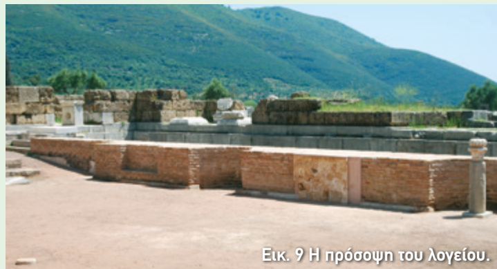
Εικ. 9 Η πρόσοψη του λογείου.

τις ανάγκες μιας παράστασης, συρόταν προς το κέντρο (εικ. 10). Όταν, πάλι, η χρήση της ολοκληρωνόταν, συρόταν μέσα στη σκηνοθήκη και αποθηκευόταν εκεί.