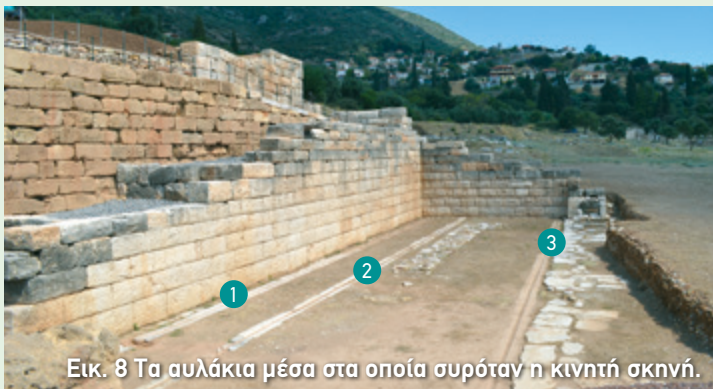
Εικ. 8 Τα αυλάκια μέσα στα οποία συρόταν η κινητή σκηνή.