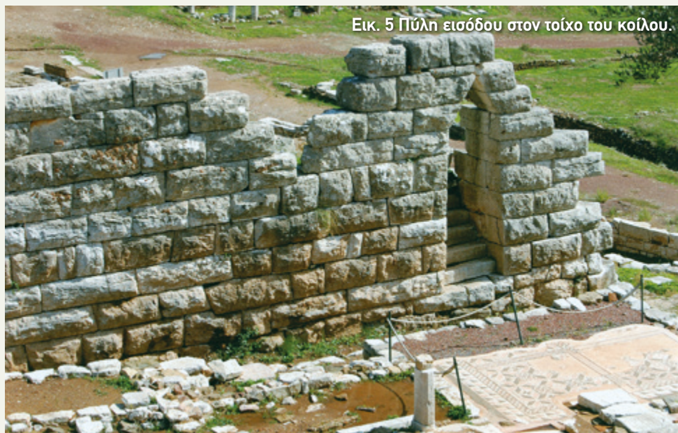
Εικ. 5 Πύλη εισόδου στον τοίχο του κοίλου.

Το κοίλο όμως είχε ένα ακόμη πολύ ιδιαίτερο στοιχείο. Για να το δείτε, θα χρειαστεί να βγείτε έξω από το θέατρο και να περπατήσετε κατά μήκος του αναλημματικού τοίχου. Στο πίσω μέρος του κοίλου, θα συναντήσετε μία μεγάλη σκάλα που καταλήγει στον τοίχο. Ίσως να σκεφτείτε ότι ήταν μία ακόμη σκάλα που