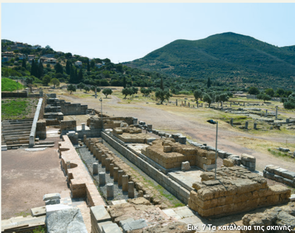
Εικ. 7 Τα κατάλοιπα της σκηνής.

ότι θα υπήρχαν τουλάχιστον άλλοι τέσσερις και όλοι τους προορίζονταν για τους υψηλούς αξιωματούχους της πόλης. Εκτός από τους θρόνους, στην περίμετρο της ορχήστρας υπήρχαν και τιμητικά αγάλματα, κυρίως χάλκινοι ανδριάντες αυτοκρατόρων, διακεκριμένων πολιτών και ευεργετών της Μεσσήνης, τοποθετημένα πάνω σε βάθρα (εικ. 6).