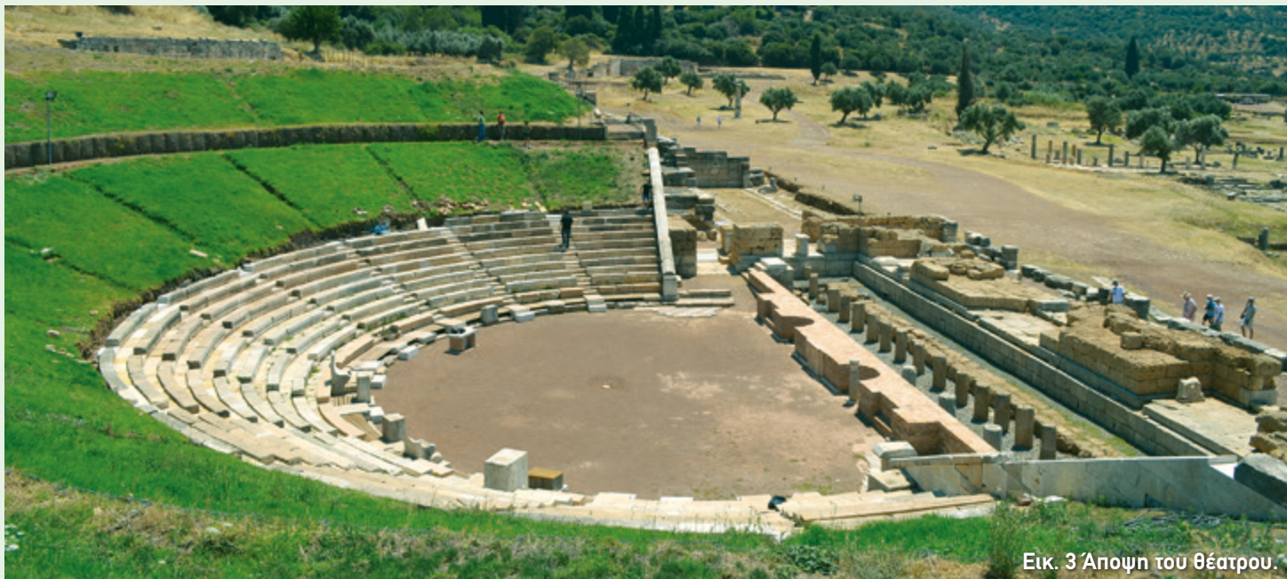
Εικ. 3 Άποψη του θεάτρου.

Στις αρχές του 4ου αι. μ.Χ. το θέατρο, πρώτο από κάθε άλλο κτήριο της αρχαίας μεσσηνιακής πρωτεύουσας, αφέθηκε στην τύχη του, ύστερα από έξι περίπου αιώνες λειτουργίας. Οι ελάχιστοι κάτοικοι που είχαν απομείνει στην ερημωμένη πόλη χρησιμοποίησαν τις πέτρες του για να κατασκευάσουν νέες οικοδομές, κάτι που δεν σταμάτησε να γίνεται σε όλη την περίοδο της Βενετοκρατίας μέχρι και τον 15ο αι. μ.Χ.