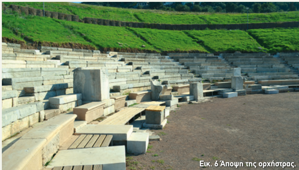
Εικ. 6 Άποψη της ορχήστρας.

Κάτω από την κατασκευή με τις ξύλινες σανίδες που θα δείτε γύρω από την ορχήστρα, βρίσκεται ο αποχετευτικός αγωγός του θεάτρου, καλυμμένος με πλάκες (εικ. 6). Συγκέντρωνε τα νερά της βροχής, που κατέβαιναν από το κοίλο, και, αφού περνούσε κάτω από τη σκηνή, τα μετέφερε σε έναν δεύτερο μεγάλο υπόγειο αγωγό. Σε κάποιες από τις πλάκες διακρίνονται οπές. Πρόκειται για τρύπες όπου στερεώνονταν οι ξύλινοι πάσσαλοι ενός κιγκλιδώματος. Ήταν, δηλαδή, μια μορφή περιφραξης που προστάτευε τους θεατές στη διάρκεια των μονομαχιών στο θέατρο τα ρωμαϊκά χρόνια. Πάντως, τα αγαπημένα θεάματα των Ρωμαίων πραγματοποιούνταν