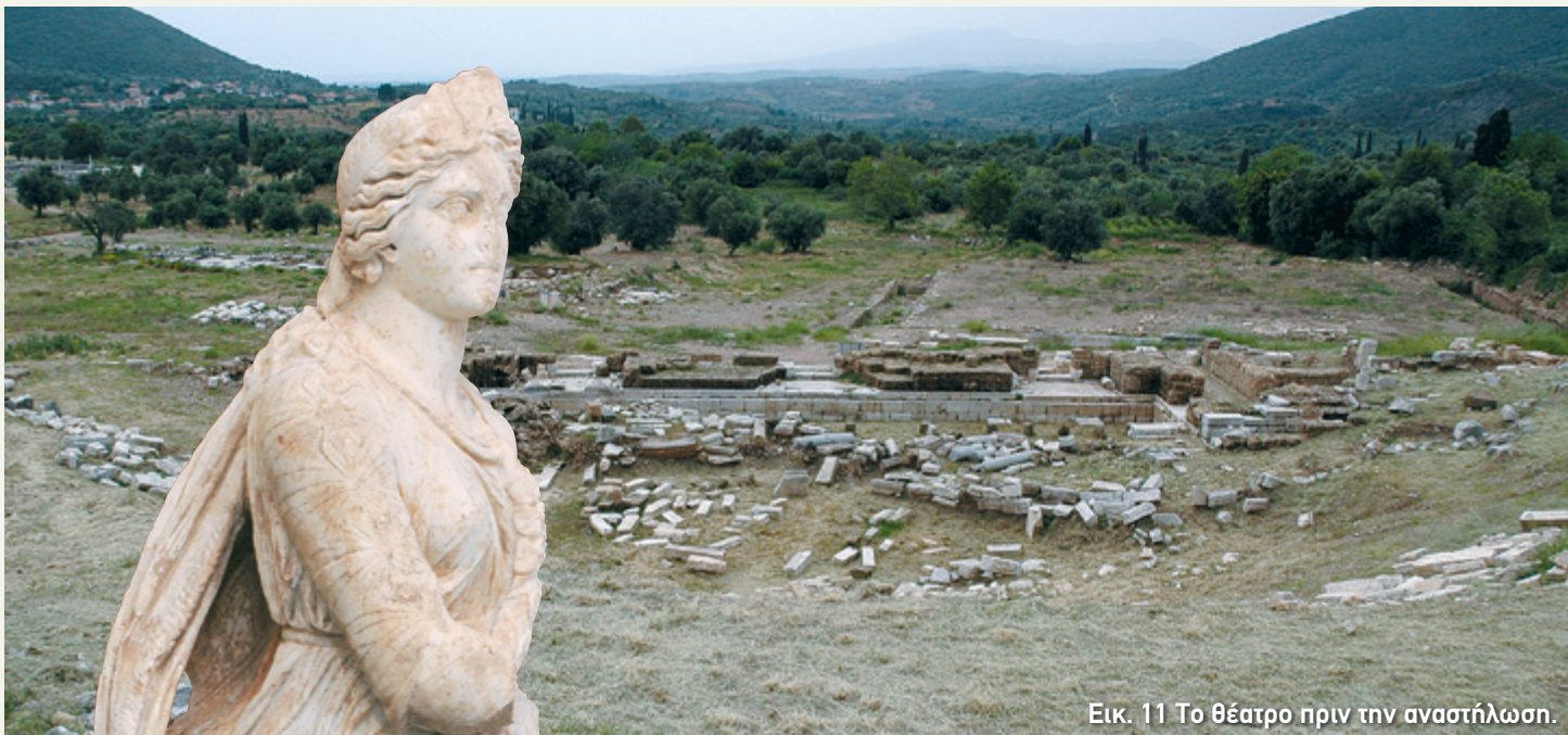
Εικ. 11 Το θέατρο πριν την αναστήλωση.