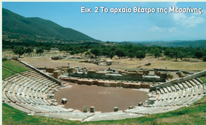
Εικ. 2 Το αρχαίο θέατρο της Μεσσήνης.

ήταν τεχνίτες του Διονύσου , καλλιτέχνες δηλαδή του θεάτρου, όπως ηθοποιοί, μουσικοί κ.ά., οι οποίοι αποτελούσαν ιδιαίτερη τάξη στη μεσσηνιακή κοινωνία. Αυτό συμπεραίνουμε από τις επιγραφές που εντοπίστηκαν σε καθίσματα του κοίλου ή σε βάθρα αγαλμάτων: στην επιφάνειά τους είναι χαραγμένα τα ονόματα αγωνοθετών , δηλαδή εύπορων πολιτών που αναλάμβαναν τη διοργάνωση των θεαμάτων στις γιορτές προς τιμή του θεού Διονύσου. Οι δούλοι, λοιπόν, απελευθερώνονταν από τους κυρίους τους, οι οποίοι με αυτόν τον τρόπο τους έβηταν υπό την προστασία του Διονύσου.