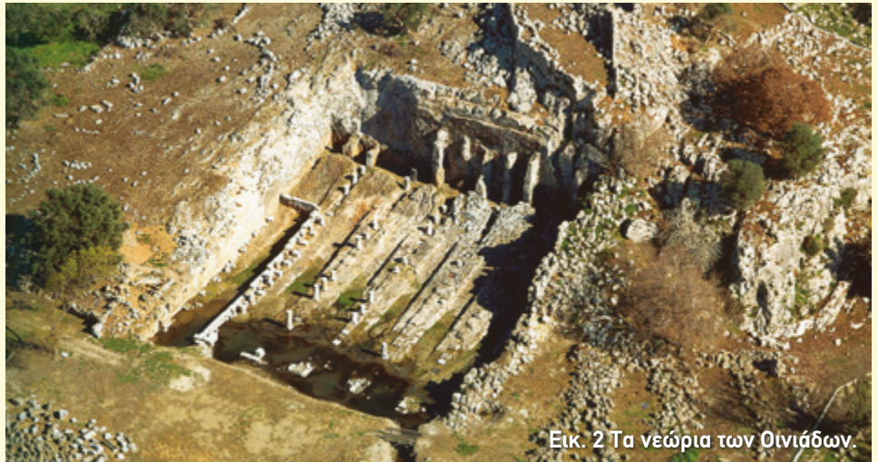
Εικ. 2 Τα νεώρια των Οινιάδων.

Ήταν όμως η θέση τους κυρίως που ευνόησε την οικονομική και πολιτιστική άνθηση που γνώρισαν οι Οινιάδες. Η πόλη χτίστηκε σε απόσταση αναπνοής από τις εκβολές του Αχελώου, πάνω σε ένα λόφο κοντά στο σημερινό χωριό Κατοχή που από τον 15ο αι. ονομάζεται «Τρίκαρδος» (εικ. 1). Το σημείο ήταν, πράγματι, εξαιρετικό. Οι Ακαρνανές μπορούσαν να ελέγχουν το θαλάσσιο δρόμο ανάμεσα στην επικράτειά τους και τα νησιά της Λευκάδας, της Ιθάκης και της Κεφαλλονιάς, καθώς και τα περάσματα από και προς τον Πατραϊκό κόλπο, κι ακόμα να απολαμβάνουν τα αγαθά της εύφορης γης. Εξίσου σημαντικό είναι ότι η πόλη ήταν ενδιάμεσος σταθμός για τα πλοία που μετέφεραν προϊόντα προς την Ιταλία και τη βόρεια Αδριατική.