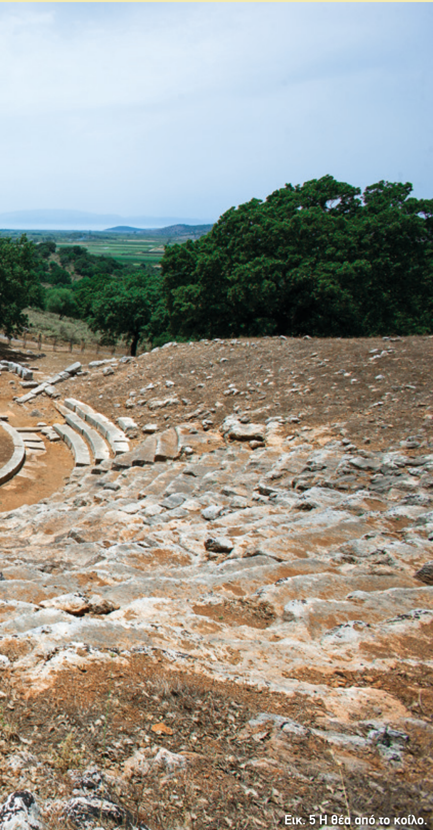
Εικ. 5 Η θέα από το κοίλο.