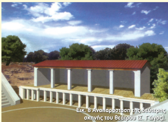
Εικ. 8 Αναπαράσταση της δεύτερης σκηνής του θεάτρου (Σ. Γώγος).

Μέσα στον φάκελο θα βρείτε πληροφορίες για δύο ακόμη από τα παραπάνω θέατρα της Αιτωλοακαρνανίας. Αναζητήστε τα έντυπα για τα αρχαία θέατρα του Στράτου και της Πλευρώνας.