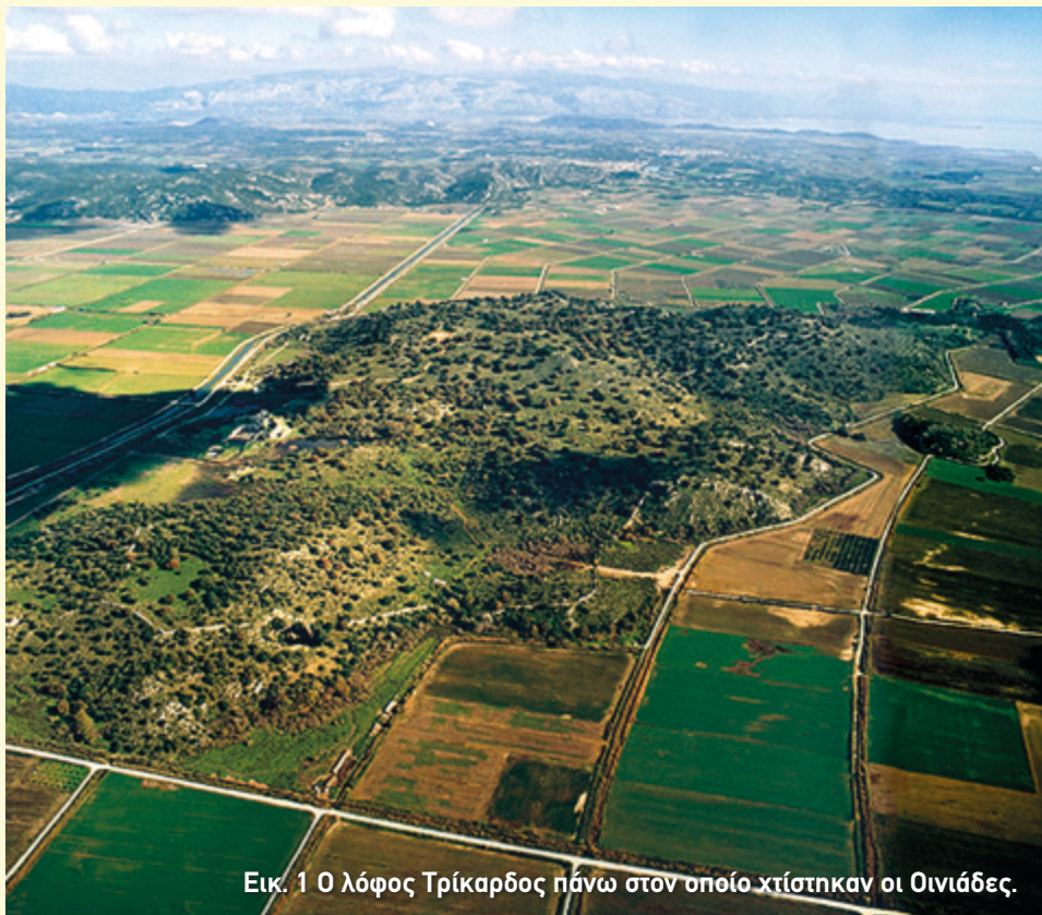
Εικ. 1 Ο λόφος Τρίκαρδος πάνω στον οποίο χτίστηκαν οι Οινιάδες.

Ύστερα από την ναυμαχία του Ακτίου, η οποία πραγματοποιήθηκε το 31 π.Χ. ανάμεσα στον Γάιο Ιούλιο Καίσαρα Οκταβιανό και τον Μάρκο Αντώνιο για τον έλεγχο του κράτους της Ρώμης, η Ακαρνανία έχασε την αυτοδυναμία της. Το Κοινό διαλύθηκε και οι κάτοικοι, όπως και της Αιτωλίας και της