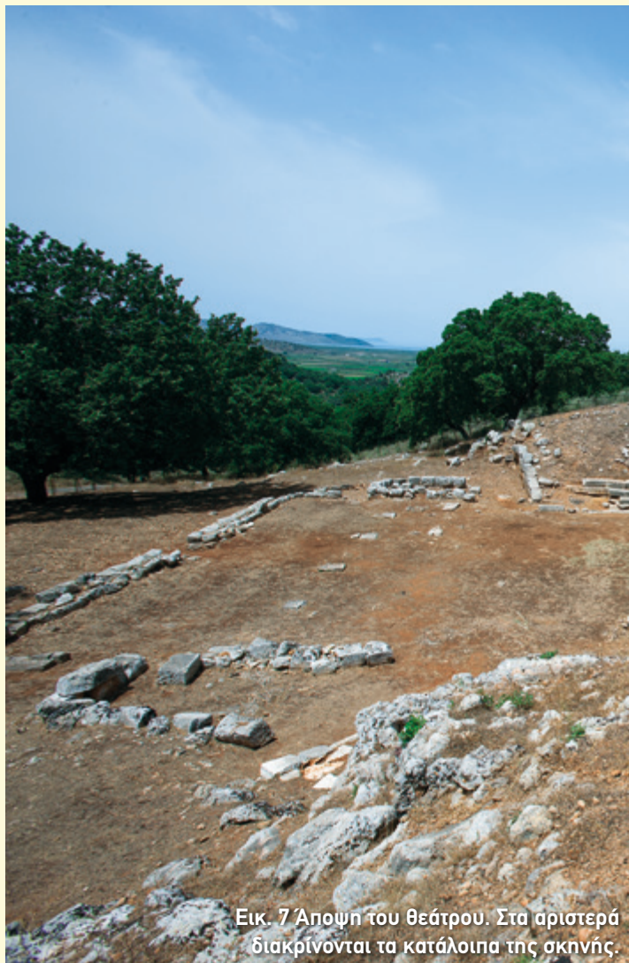
Εικ. 7 Αποψη του θεάτρου. Στα αριστερά διακρίνονται τα κατάλοιπα της σκηνής.

Στην εικόνα 8 μπορείτε να δείτε πώς φαντάστηκαν οι αρχαιολόγοι τη μορφή που θα είχε η σκηνή.