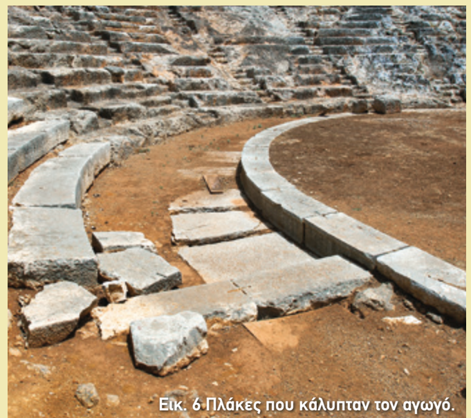
Εικ. 6 Πλάκες που κάλυπταν τον αγωγό.

Η ορχήστρα σχημάτιζε έναν κύκλο, είχε διάμετρο περίπου 16 μέτρα και το δάπεδό της ήταν από πατημένο χώμα (εικ. 3, 5). Οι πλάκες που βλέπει κανείς πίσω από το λίθινο πλαίσιο στην περιφέρεια της ορχήστρας, κάλυπταν τον αγωγό που οδηγούσε τα νερά της βροχής έξω από το θέατρο (εικ. 6). Ταυτόχρονα όμως δημιουργούσαν κι έναν διάδρομο που διευκόλυνε την πρόσβαση των θεατών προς το κοίλο. Φαίνεται ότι η ορχήστρα διαμορφώθηκε με τα χρήματα που δόθηκαν από κάποια χορηγία, αφού σε τμήμα της σκηνής σώθηκε αποσπασματικά μία επιγραφή που αναφέρεται σε αυτή: (ΤΗ)Ν ΟΡΧΗΣΤ(ΡΑ)Ν.