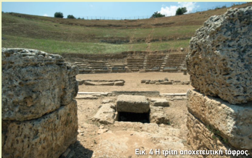
Εικ. 4 Η τρίτη αποχετευτική τάφρος.