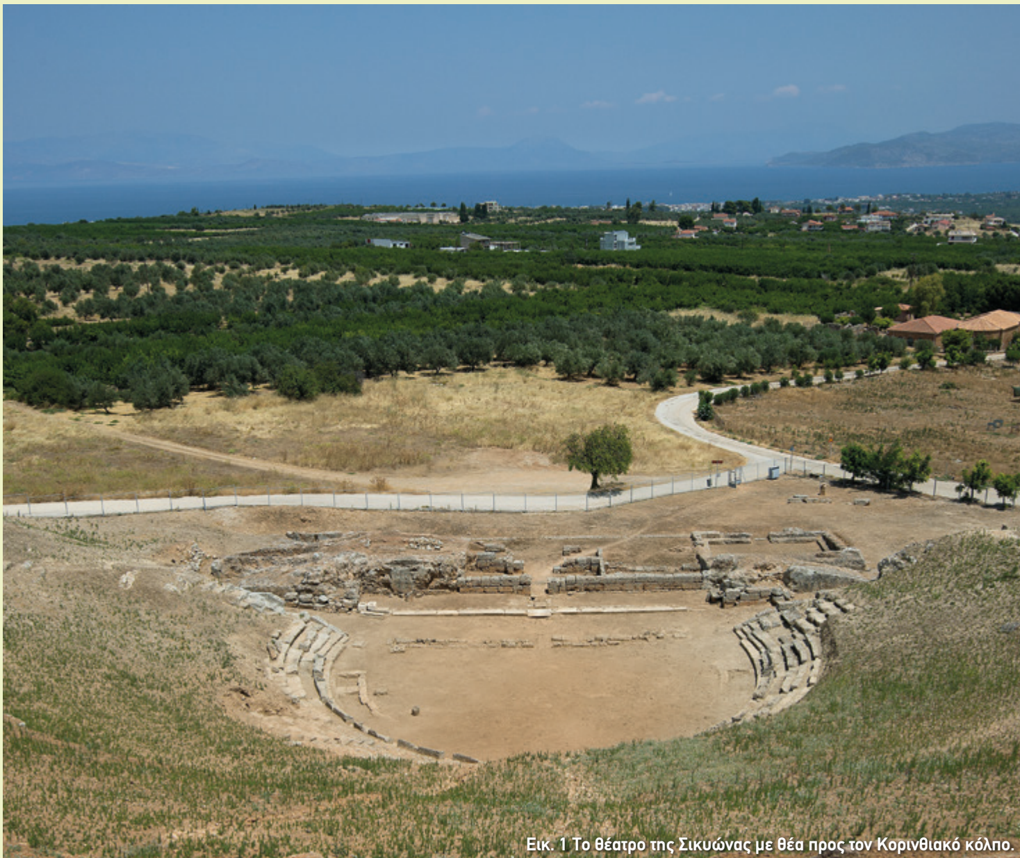
Εικ. 1 Το θέατρο της Σικυώνας με θέα προς τον Κορινθιακό κόλπο.