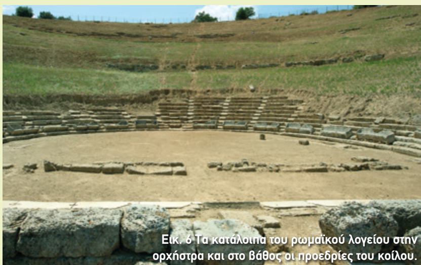
Εικ. 6 Τα κατάλοιπα του ρωμαϊκού λογείου στην ορχήστρα και στο βάθος οι προεδρίες του κοίλου.