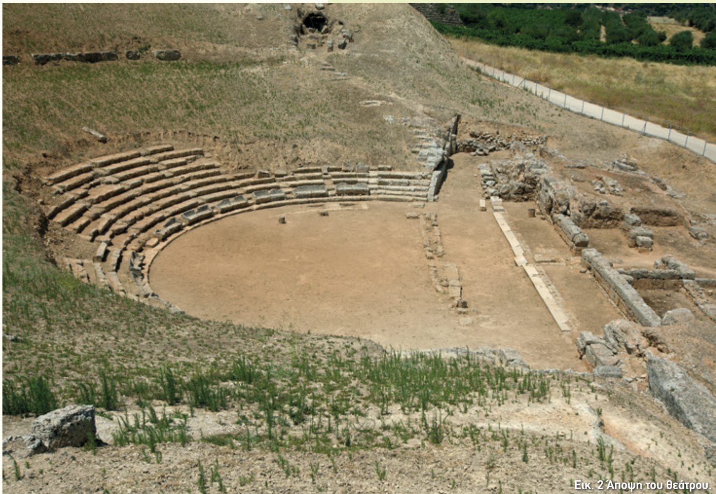
Εικ. 2 Άποψη του θεάτρου.