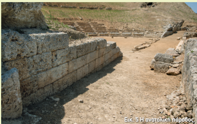
Εικ. 5 Η ανατολική πάροδος.