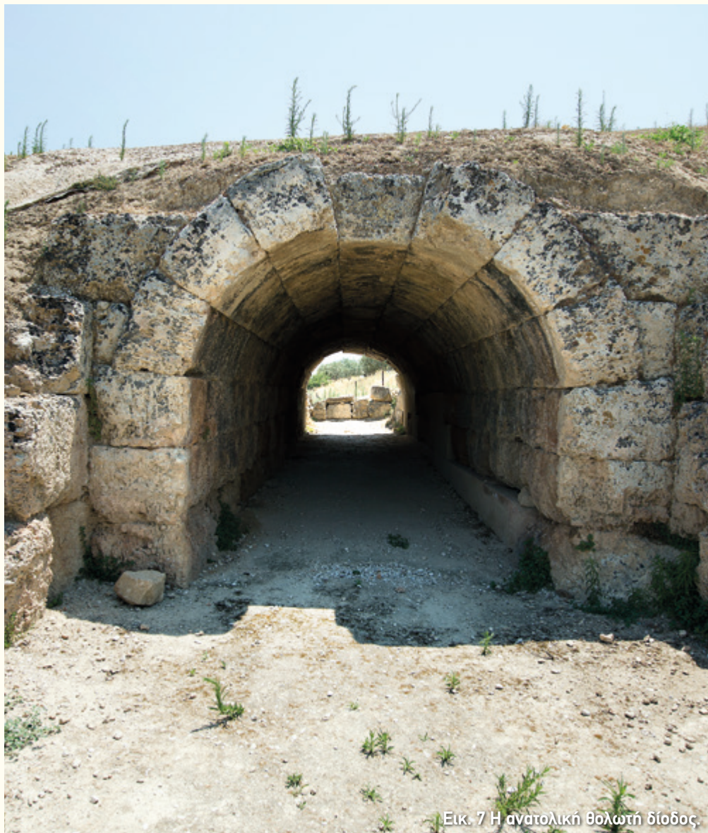
Εικ. 7 Η ανατολική θολωτή διάδος.

Χαρακτηριστικό στοιχείο του θεάτρου είναι οι δύο θολωτές δίοδοι στα δύο άκρα του πρώτου διαζώματος, οι οποίες αποτελούσαν και τις κύριες εισόδους των θεατών (εικ. 2). Είχαν μήκος 16 μέτρα, πλάτος και ύψος περίπου 2,60 μέτρα και αποτελούν ένα σπάνιο δείγμα αρχιτεκτονικής θολωτής κατασκευής της εποχής τους. Η ανατολική είναι αναστηλωμένη, αλλά εκκρεμεί η αποκατάσταση της δυτικής (εικ. 7).