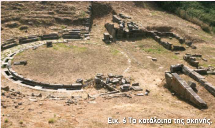
Εικ. 6 Τα κατάλοιπα της σκηνής.

Ήταν το 1805, όταν εντοπίστηκε το θέατρο. Χρόνια όμως αργότερα το κτήριο δεν ήταν και πάλι ορατό, ώσπου στα τέλη του 19ου αι. η θέση του ταυτίστηκε για μία ακόμη φορά. Τελικά, μετά από έναν περίπου αιώνα, την περίοδο 1990-1996, Έλληνες και Γερμανοί αρχαιολόγοι έφεραν στο φως το θέατρο της αρχαίας πόλης, δυστυχώς όμως αρκετά κατεστραμμένο. Έτσι, σήμερα όλα τα μέρη του θεάτρου, και κυρίως το κοίλο, έχουν ανάγκη από άμεση στερέωση και αναστήλωση, γι' αυτό και ο χώρος προσφέρεται μόνο για επίσκεψη.