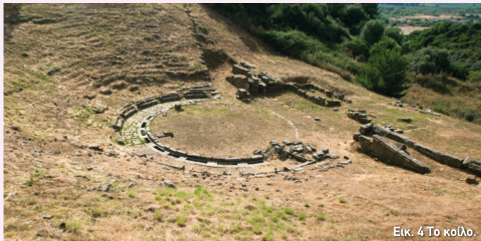
Εικ. 4 Το κοίλο.

Η ορχήστρα είναι από πατημένο χώμα και σχηματίζει κύκλο που έχει διάμετρο 15,5 μέτρα (εικ. 4, 5). Ένα λίθινο πλαίσιο που την περιβάλλει μοιάζει να ορίζει τον χώρο της. Πίσω από αυτό βρίσκεται ο αποχετευτικός αγωγός του θεάτρου, ο οποίος ανά δύο μέτρα περίπου ήταν καλυμμένος με πλάκες. Λίγο πριν φτάσει στην ανατολική πάροδο , δηλαδή τον διάδρομο που σχηματίζεται ανάμεσα στο δεξί άκρο του κοίλου και τη σκηνή, ο αγωγός γινόταν υπόγειος και περνούσε κάτω από τη σκηνή για να απομακρύνει έξω από το θέατρο τα νερά της βροχής.