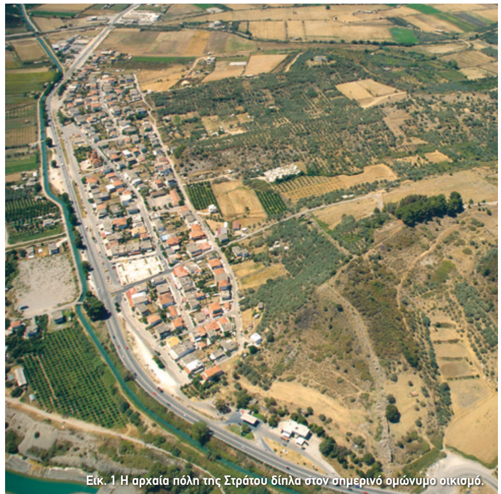
Εικ. 1 Η αρχαία πόλη της Στράτου δίπλα στον σημερινό ομώνυμο οικισμό.

Ύστερα από την ναυμαχία του Ακτίου, η οποία πραγματοποιήθηκε το 31 π.Χ. ανάμεσα στον Γάιο Ιούλιο Καίσαρα Οκταβιανό και τον Μάρκο Αντώνιο για τον έλεγχο του κράτους της Ρώμης, η Ακαρνανία έχασε την αυτοδυναμία της. Το Κοινό διαλύθηκε και οι κάτοικοι, όπως και της Αιτωλίας και της Ηπείρου, υποχρεώθηκαν να γίνουν μέτοικοι της Νικό-