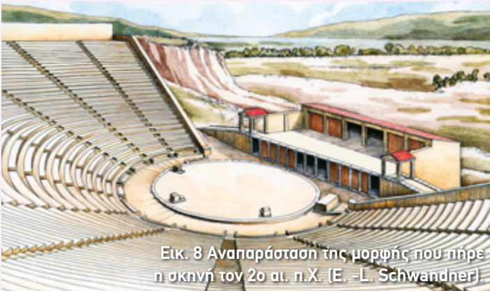
Εικ. 8 Αναπαράσταση της μορφής που πήρε η σκηνή τον 2ο αι. π.Χ. (E. -L. Schwandner).