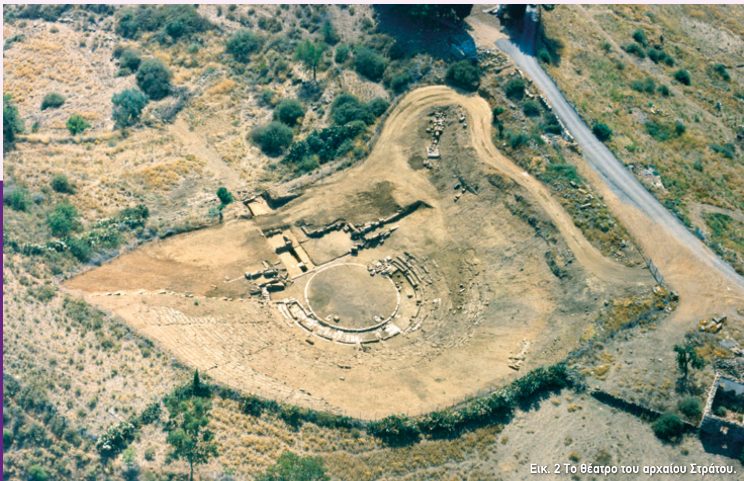
Εικ. 2 Το θέατρο του αρχαίου Στράτου.

Το 30 π.Χ. ο Στράτος ερήμωσε, όμως από το τέλος των ρωμαϊκών χρόνων και μετά απέκτησε και πάλι αξία. Τον 19ο αι., πάνω στα ερείπιά του χτίστηκε το χωριό Σοροβίγλι. Το 1960 το χωριό μεταφέρθηκε στη σημερινή του θέση και σε ανάμνηση της αρχαίας πόλης μετονομάστηκε σε «Στράτος».