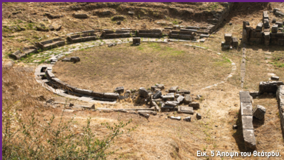
Εικ. 5 Αποψη του θεάτρου.

Αυτές όμως δεν ήταν οι μοναδικές προεδρίες που είχε το θέατρο. Κατά την ανασκαφή βρέθηκαν στην ορχήστρα σπασμένα κομμάτια από την πλάτη δύο προεδριών που ήταν τοποθετημένες στο δεξί, αλλά και στο πάνω μέρος της ορχήστρας, ενώ φαίνεται ότι θα υπήρχε και μία τρίτη προεδρία στην αριστερή πλευρά (εικ. 5, 8). Αυτά τα τιμητικά καθίσματα είχαν κατασκευαστεί κατά την τελευταία περίοδο λειτουργίας του θεάτρου, δηλαδή τον 2ο αι. π.Χ.