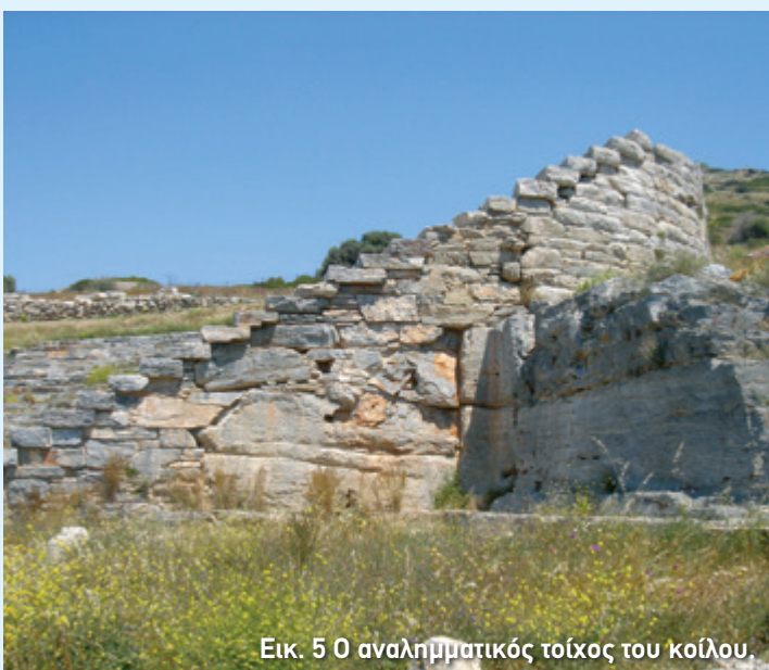
Εικ. 5 Ο αναλημματικός τοίχος του κοίλου.

Την ίδια εποχή προστέθηκε και το άνω κοίλο κι έτσι η χωρητικότητα του θεάτρου έφτασε περίπου τους 6.000 θεατές. Το άνω κοίλο προσαρμόστηκε στη μορφή που είχε το κάτω, ήταν όμως ενιαίο, δεν χωριζόταν, δηλαδή, σε κερκίδες. Έτσι, ο χώρος των θεατών πήρε το ασυνήθιστο σχήμα που φαίνεται στην εικόνα 3. Για να στηρίζονται με ασφάλεια τα εδώλια, γύρω από το κοίλο χτίστηκε ένας αναλημματικός τοίχος , ένας ισχυρός κατακόρυφος τοίχος, δηλαδή, που συγκρατούσε τα χώματα (εικ. 5). Αν κατευθυνθείτε στην πίσω πλευρά του, θα δείτε δύο ράμπες (εικ. 3). Από αυτές μπορούσε κανείς να φτάσει απευθείας στο άνω κοίλο.