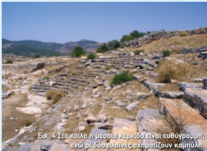
Εικ. 4 Στο κοίλο η μεσαία κερκίδα είναι ευθύγραμμη, ενώ οι δύο πλαϊνές σχηματίζουν καμπύλη.