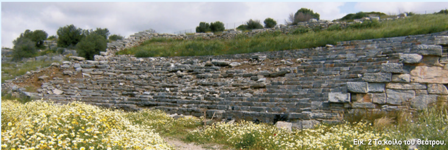
Εικ. 2 Το κοίλο του θεάτρου.