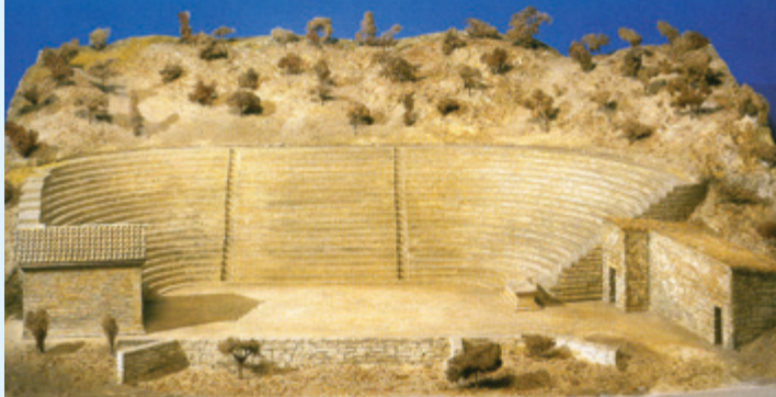
Εικ. 7 Πρόταση αναπαράστασης του θεάτρου.