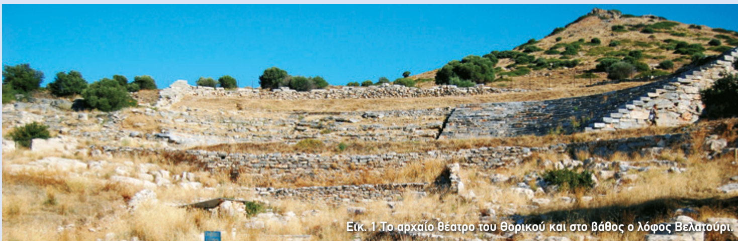
Είκ. 1 Το αρχαίο θέατρο του Θορικού και στο βάθος ο λόφος Βελατούρι.

Όταν στο τέλος του 6ου αι. π.Χ. (508/507 π.Χ.) ο Κλεισθένης εγκαθίδρυσε στην Αθήνα το δημοκρατικό πολίτευμα, μία από τις θεμελιώδεις μεταρρυθμίσεις του ήταν η διαίρεση των κατοίκων της Αττικής σε εκατόν εβδομήντα δήμους και η κατανομή τους σε δέκα νέες φυλές. Έτσι, σε κάθε μία από αυτές έπρεπε να ανήκουν πολίτες διαφορετικών περιοχών. Η νέα διαίρεση καθιέρωσε την ισονομία ανάμεσα στους κατοίκους του αστικού κέντρου και της υπαίθρου και οι επιμέρους δήμοι σχημάτισαν την πόλη-κράτος των Αθηνών.