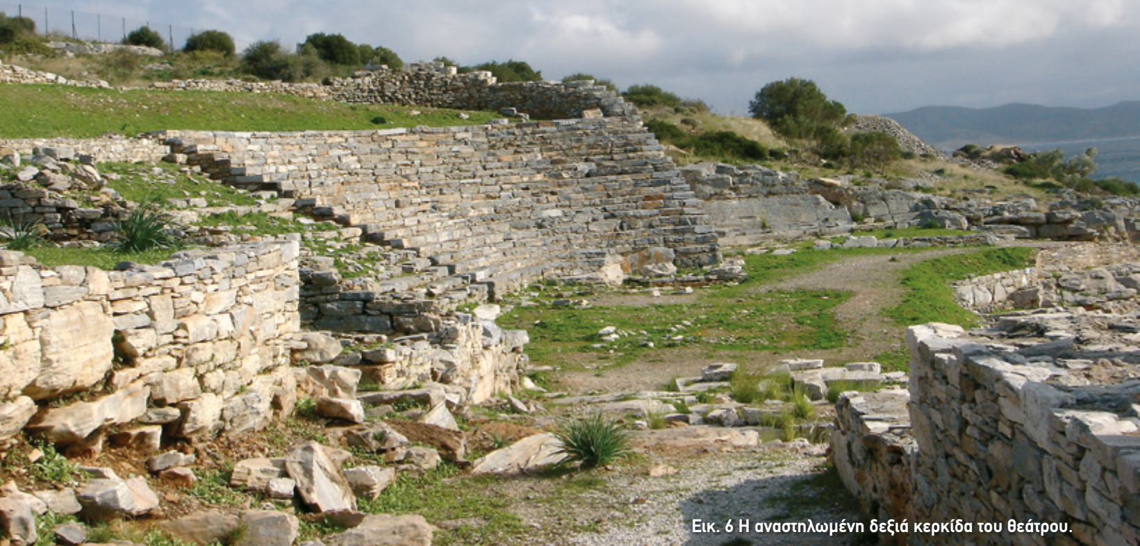
Εικ. 6 Η αναστηλωμένη δεξιά κερκίδα του θεάτρου.